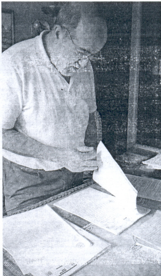
'PRUEBAS'. El vecino muestra los documentos.