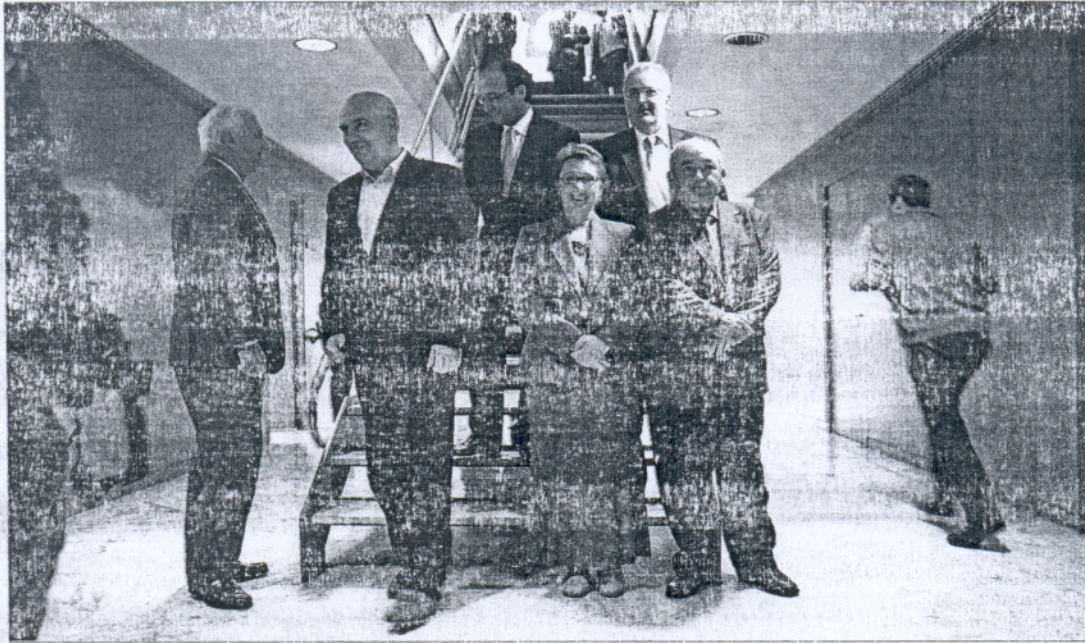
Los firmantes del VII Acuerdo de Concertación, ayer tras finalizar la reunión en la Consejería de Economía y Hacienda.