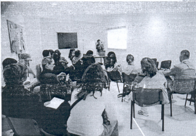
Imagen de una de las Escuelas Taller puestas en marcha en la provincia en los últimos cuatro años.

A su vez, Cádiz es la segunda provincia que más dinero tiene asignado, por detrás de Sevilla, con 40,3 millones de euros, y por encima de Málaga, con 30 millones de euros. La provincia también es la segunda provincia en cuanto al número de proyectos que se pondrán en marcha en Políticas Activas de Empleo, con 67 proyectos, por debajo de Sevilla, provincia que ocupa el primer lugar con 72 proyectos. La misma