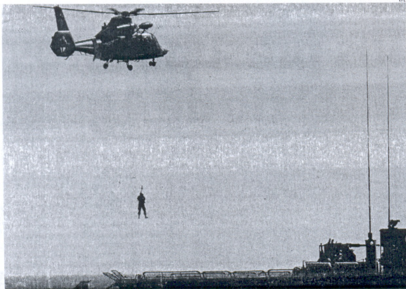
Las aguas gaditanas fueron ayer escenario de un ejercicio en el que participaron setecientos militares.

EJÉRCITO Es la primera actividad en Cádiz de la 'Iniciativa 5+5'