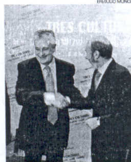
Griñán y Rubalcaba.

Se trata de obras básicas para la conservación y la mejora de la habitabilidad de las instalaciones, tales como la restauración de las fachadas, el acondicionamiento de dependencias oficiales y pabellones, la eliminación de barreras arquitectónicas, la impermeabiliza-