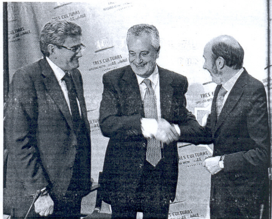
Pizarro, Griñán y Rubalcaba se saludaban ayer en Sevilla en presencia de Juan Espadas

a apuntar con el dedo el nombre de ningún aspirante para 2011 hasta que no sea una decisión firme. No sólo porque «los precandidatos se achicharran», decía gráficamente un portavoz de la dirección del PSOE andaluz, sino porque entorpecería enormemente la labor de los que actualmen-