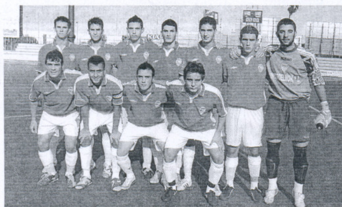
Los juveniles del Portuense (Liga Nacional) dependen de sí mismos para salvarse.