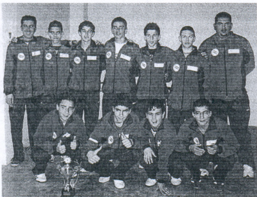
Plantilla de la selección gaditana cadete ganadora en Málaga.