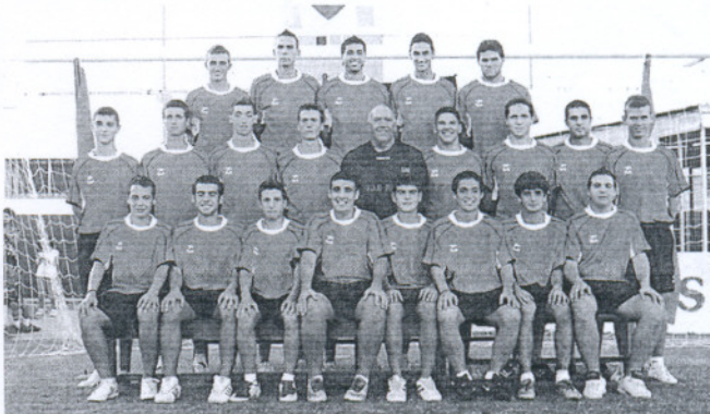
La Roteña (Preferente juvenil) dio un paso adelante fundamental para lograr la permanencia.