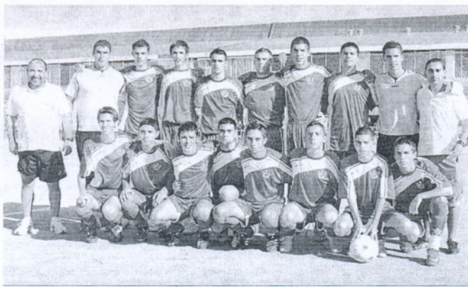
La Salle PR B juvenil mantiene vivas sus opciones de ascenso.

DESCANSA: Sporting San Fdo B y Vejer Bpié.