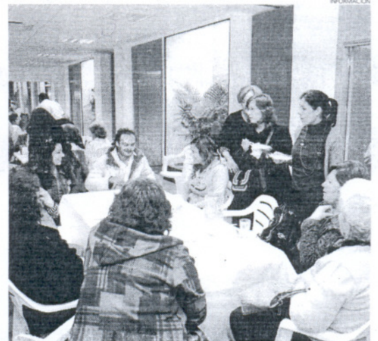
Los alumnos y alumnas de Baifora degustaron este postre tan típico.

Para el jueves día 2 de abril, la compañía Bombastic Teatro representará para ellos la obra Lazarillo de Tormes en una sesión que tendrá lugar a las diez de la mañana, en el auditorio municipal. Las actividades concluyen el viernes 3 de abril con la celebración de un certamen literario y una entrega de diplomas.