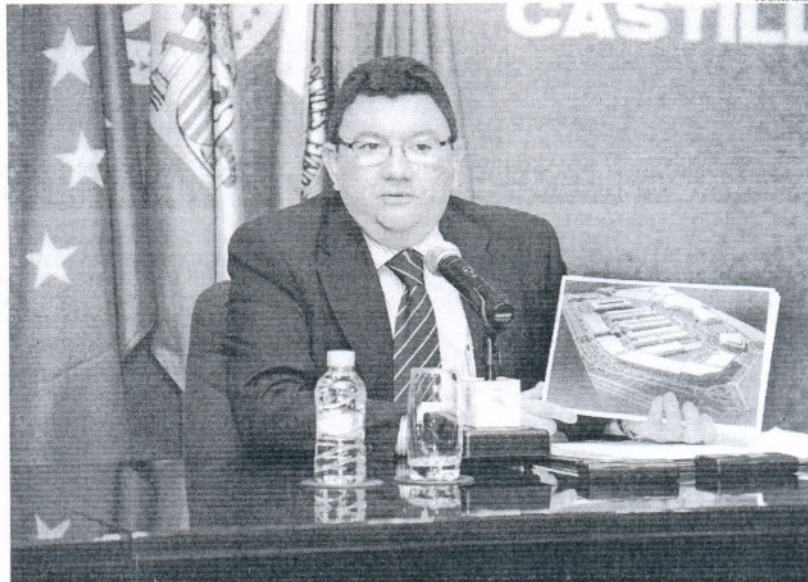
El alcalde se ha mostrado muy esperanzado de la acogida que ha tenido el proyecto del nuevo polígono.

El polígono industrial, que se ubicará en el sector SUN R11, ad-