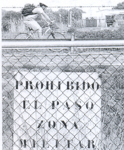
Un control del recinto militar, en una imagen de archivo.

Según explica el diputado del PP, aunque existen pronunciamientos judiciales que reconocen al Ayuntamiento el derecho a liquidar el impuesto, la negativa de la Administración Central, a través del Ministerio de Defensa, a pagarlo llevó al gobierno local de Rota a acudir a la vía de la compensación de oficio con las liquidaciones de IRPF, IVA y otros impuestos en los que el municipio resultaba deudor.