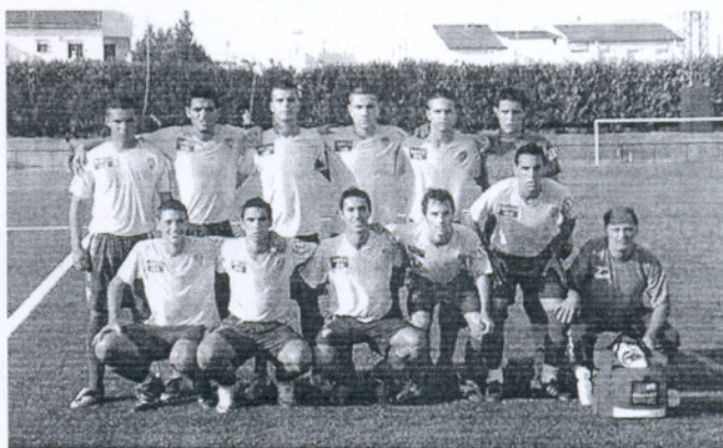
El Balón (Liga Nacional juvenil) no pudo sorprender al Xerez en Nueva Jarilla.