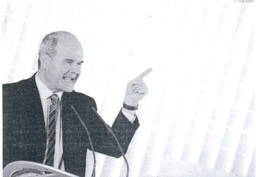
El presidente de la Junta, Manuel Chaves, durante su intervención en la Interparlamentaria del PSOE andaluz.

Calificó la propuesta del Ejecutivo como "un ataque al sentido común y a la sensibilidad de las personas" con independencia de que tengan tendencias políticas de izquierdas, de derecha o de centro, porque es "un ataque a las personas". En su opinión, la retirada formal está justificada ya que la propuesta de la nueva ley "ha recibido la condena de toda la sociedad" y, además, "los problemas de la mujer" pasan por otras cuestiones que no incluyen el aborto.