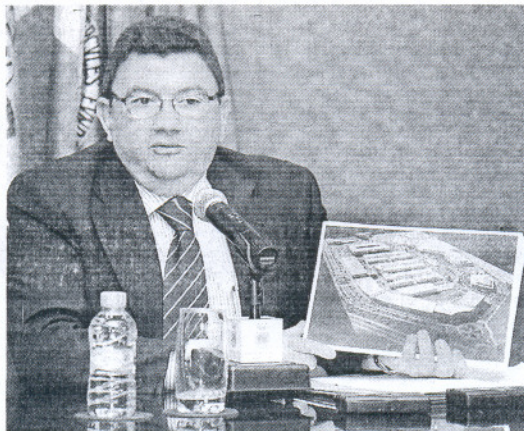
El alcalde, mostrando una imagen virtual del polígono industrial previsto.

El regidor roteño, que presentó ayer públicamente el diseño del futuro polígono industrial y comercial de la ciudad, manifestó que la pretensión municipal es "conseguir ayudas para este proyecto dentro del próximo paquete de medidas que este ministerio otorgará a través del Plan de Rein-