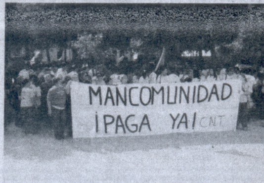
La protesta en Lebrija fue convocada por el sindicato CNT.