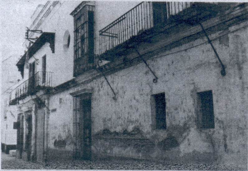
El edificio de la antigua Casa de Maternidad, situado en la calle Almonte.