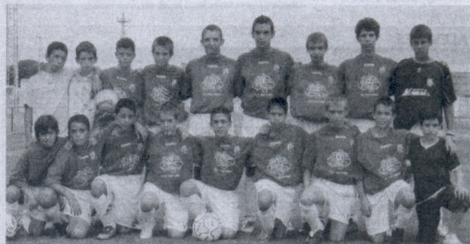
Los infantiles del Rota se afianzan en la zona alta de la clasificación del grupo 3.