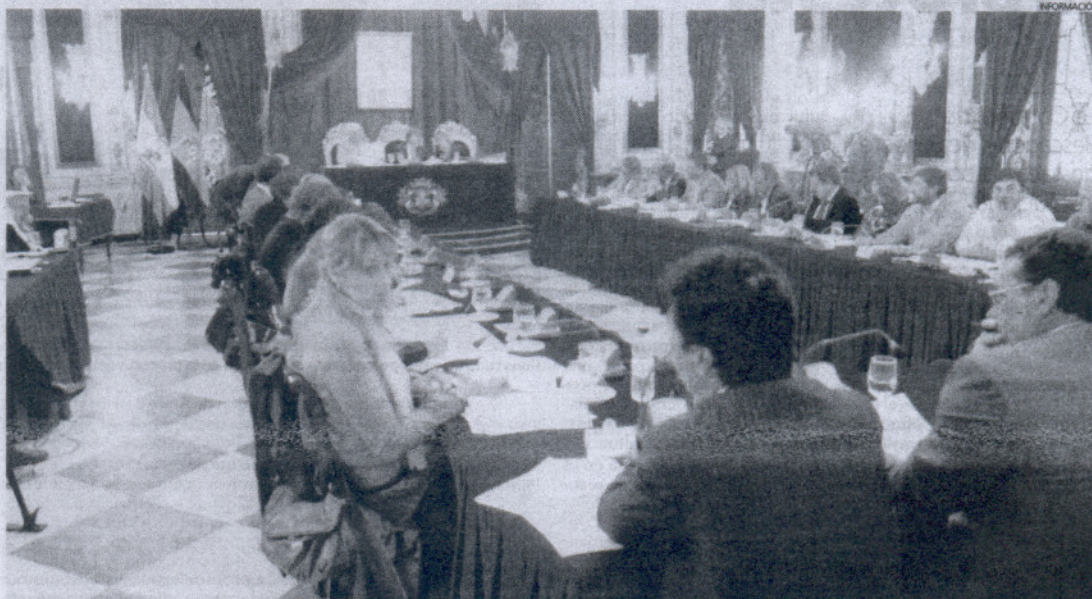
Imagen de archivo del Pleno de la Diputación Provincial de Cádiz.

pular que los trabajadores "se colocaron inmediatamente detrás de los diputados del Grupo Popular, dirigiéndose a ellos de una forma impetuosa y vehemente".