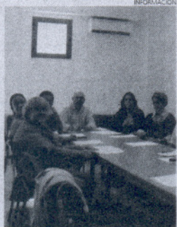
El edil con los monitores.

rano, ha mantenido un encuentro, en las instalaciones del Centro de Día Cristina Buada, con los distintos monitores que se van a encargar este curso de desarrollar el programa.