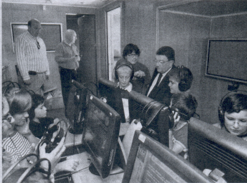
El alcalde acompañó a los escolares que visitaban en ese momento la muestra itinerante del servicio 112.

a las instalaciones, un trailer distribuido en dos espacios, una sala de conferencias y una amplia sala dotada con diez pantallas táctiles con programas interactivos donde ejerce de guía un personaje virtual que conduce al visitante a través de las distintas posibilidades de información que se ofrecen, desde la respuesta a las preguntas