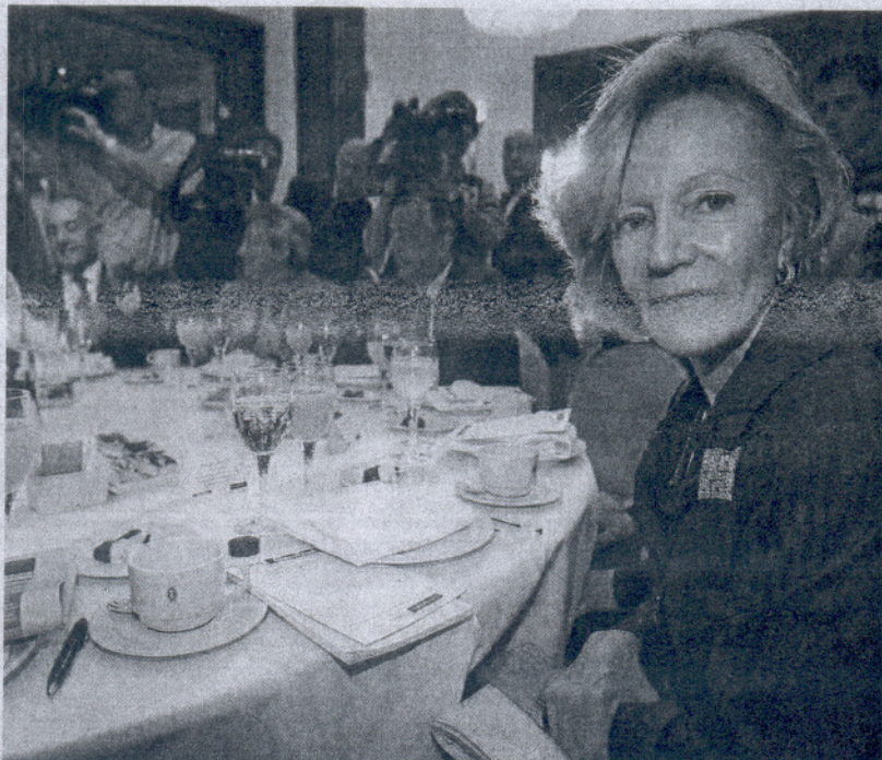
La ministra de Economía, Elena Salgado, ayer.

La titular de Economía consideró que la bajada en 14.100 desempleados en el tercer trimestre según la Encuesta de Población Activa (EPA) supone una "ruptura de la tendencia tras un pésimo primer trimestre" y es consecuencia del "efecto positivo" que están teniendo las medidas del Gobierno en el mercado laboral.