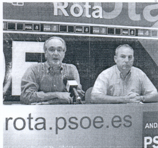
El Partido Socialista roteño pide cuentas sobre las deudas municipales.