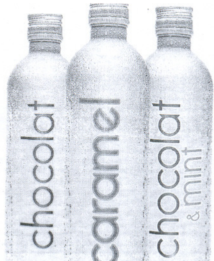
Los tres productos de la nueva gama de Grupo Garvey.

El lanzamiento de la nueva gama de Garvey estará apoyado por una campaña de promoción en puntos de venta como bares, pubs, restaurantes y lineales de alimentación. Garvey Chokolat y Garvey Chokolat & Mint tendrán un atractivo precio, pues el consumidor final podrá adquirirlo por 15,40 euros.