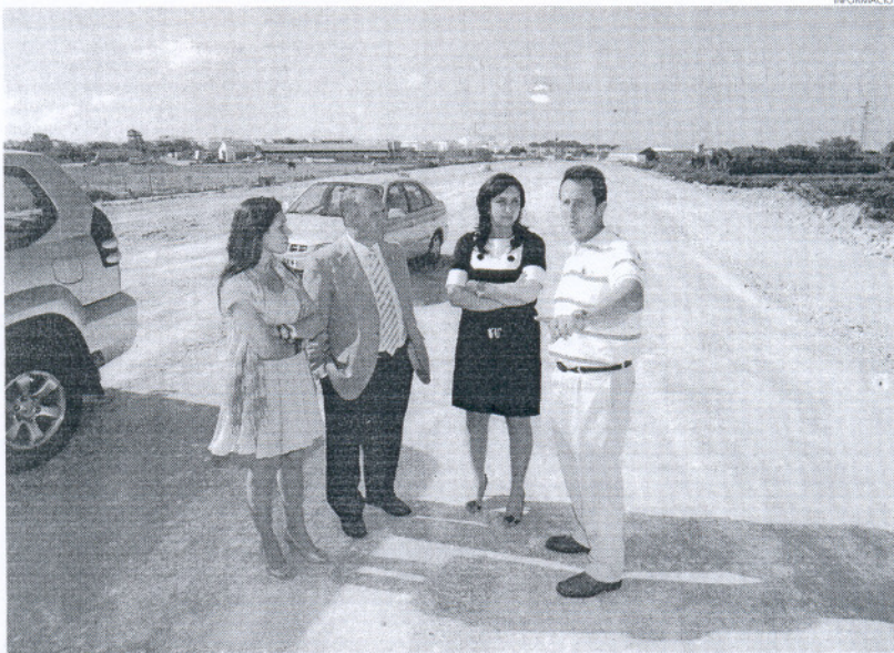
Esta gran avenida bordeará el futuro polígono Villa de Rota y lo conectará con los nuevos suelos de la ciudad.