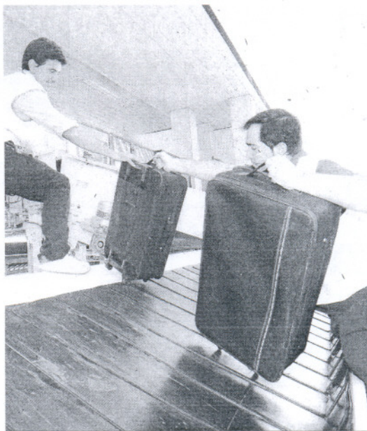
Operarios del aeropuerto de Jerez cargan maletas.

Las previsiones para la próxima temporada baja configuran una programación bien distinta: A los tres vuelos semanales directos confirmados por Air Berlin a