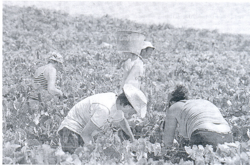
La Junta pide máximo consenso y medidas que atajen los problemas de fondo de la zona. / CRISTÓBAL

Ahora es el Marco el que tiene que consensuar su propuesta antes de la nueva cita con la Junta. ppacheco@lavozdigital.es