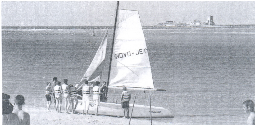
La playa de Santi Petri en Chiclana (Cádiz), una de las que recibió ayer la bandera Q de calidad por el Gobierno.

Andalucía es la región española que obtiene más galardones, diez más que el año pasado • En todo el país se entregaron 118 distinciones, 46 más que en 2008, que pertenecen a 67 ayuntamientos