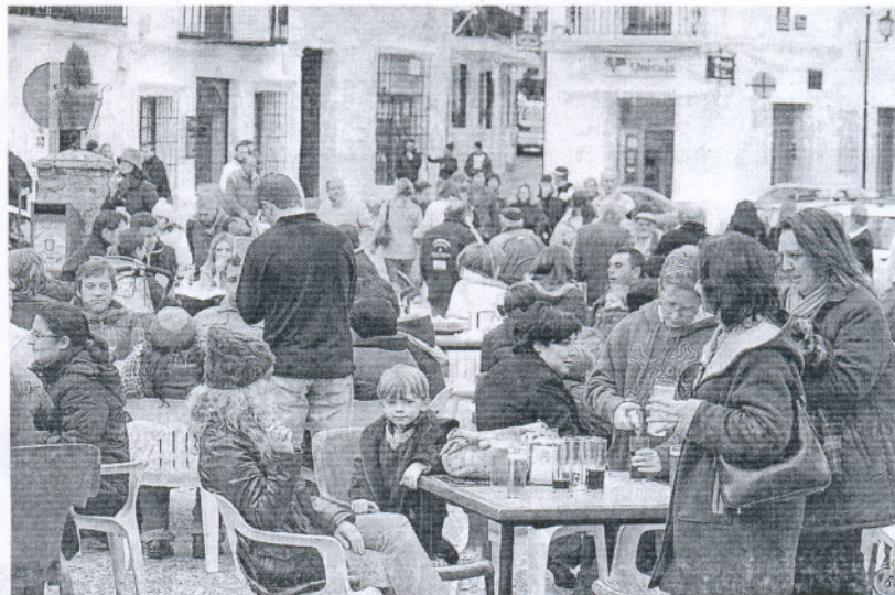
VISITANTES. Turistas, durante un fin de semana en la Sierra.