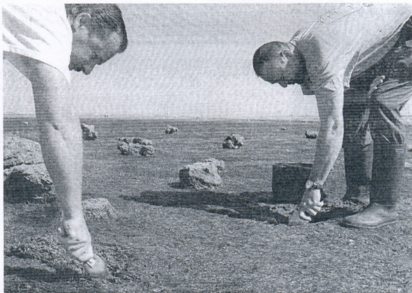
EXTRACCIÓN. Dos mariscadores capturan coquinas de fango.

El bivalvo -coquina, ostra, ostión, almeja, chirla, mejillón- se nutre de plancton, unos microorganismos que flotan en el agua. Para comerse los, absorben grandes cantidades de agua. El mismo proceso de filtrado que les permite cazar el plancton, les contamina