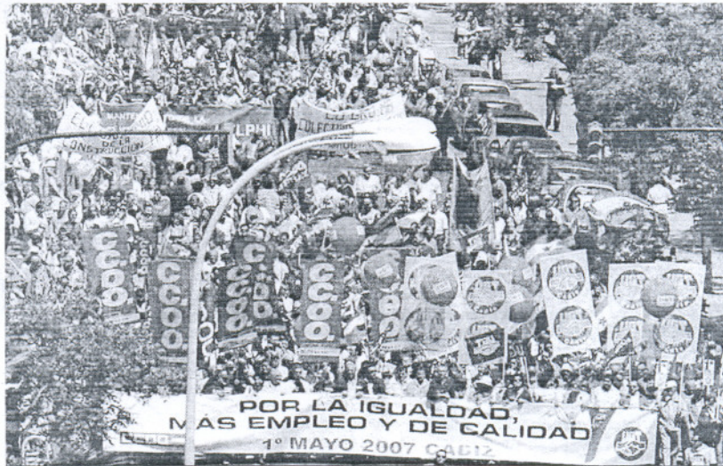
Manifestación multitudinaria del Primero de Mayo de 2007, a su paso por la Avenida de la capital gaditana.

La batería de actos reivindicativos arrancará el próximo 17 de febrero con una manifestación en Jerez. Proseguirá con una serie de encuentros de las uniones provinciales de ambos sindicatos con administraciones públicas y agentes sociales. Estas reuniones precederán a una macroasamblea de delegados de ambas centrales que se celebrará en el Palacio de Congresos de Cádiz el 3 de marzo y que culminará con una concentración ante la Subdelegación del Gobierno en Cádiz. El 8 de marzo pondrá el foco en las trabajadoras afectadas. Y para el día 21 de abril está prevista una gran manifestación en Sevilla. Todavía están por con-