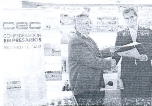
Instante de la firma del convenio entre ambas partes.