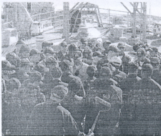
Parte del contingente que componen nada menos que 400 hombres.

edición Marruecos no ha querido participar en el proyecto pero, ha aclarado que "nadie ha querido cerrar las puertas a ese país", y que si solicitase instrucción para asegurar sus costas la recibiría del mismo modo.