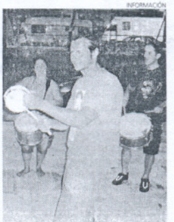
La batukada será el día 3 de enero.

dinamizar el centro de la localidad y hacerlo más atractivo para los compradores de la ciudad. El mal tiempo ha obligado a cambiar algunas fechas, pero el programa sigue en marcha.