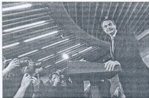
Zapatero, en la rueda de prensa.

En una larga intervención hizo el recuento de las medidas financieras y, sobre todo, de protección social, además de recordar las inyecciones de dinero a los ayuntamientos para crear empleos coyunturales. Las medidas para el próximo año tienen como objetivo impulsar la reactivación