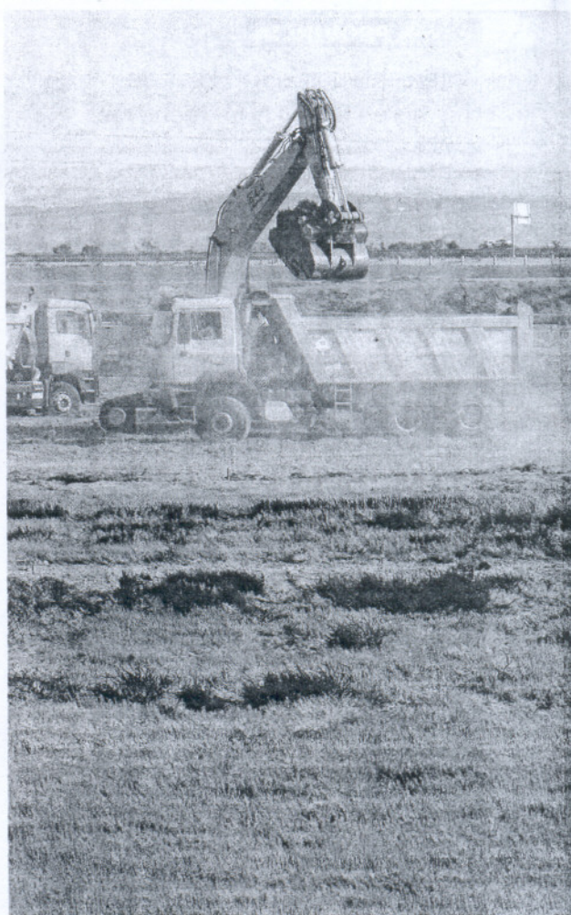
Imagen de los primeros camiones que iniciaron las obras en el polígono.