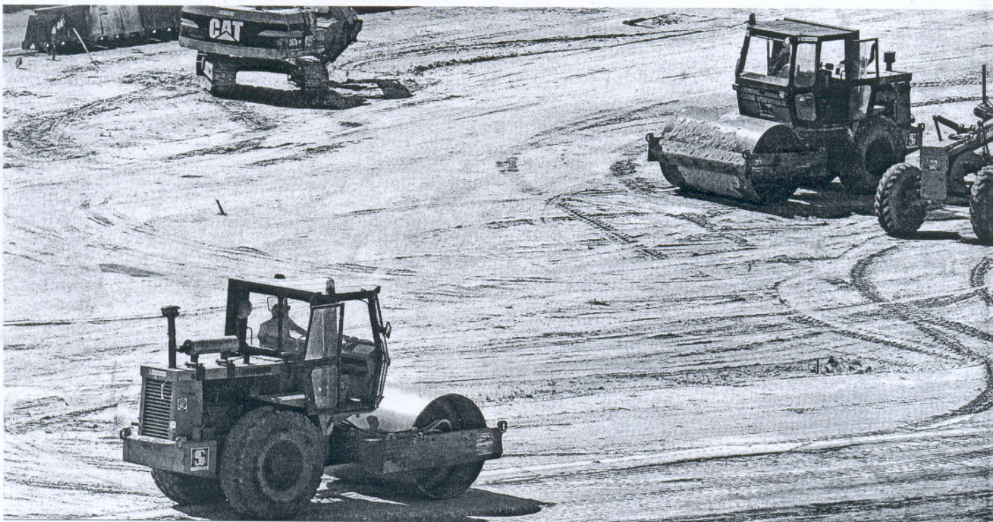
Maquinaria que ejecuta obras para la construcción de una de las carreteras en marcha en la provincia de Cádiz.

PRESUPUESTOS DE LA JUNTA EN CÁDIZ PARA 2010 Unas cuentas "austeras" pero "pensando en la gente"