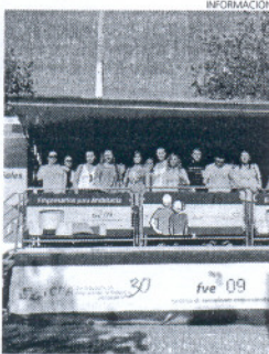
Aeciro estuvo representado.

nocimiento de la actividad emprendedora, conociendo casos prácticos y los diferentes pasos a seguir para dar inicio a su propia iniciativa empresarial de manera correcta.