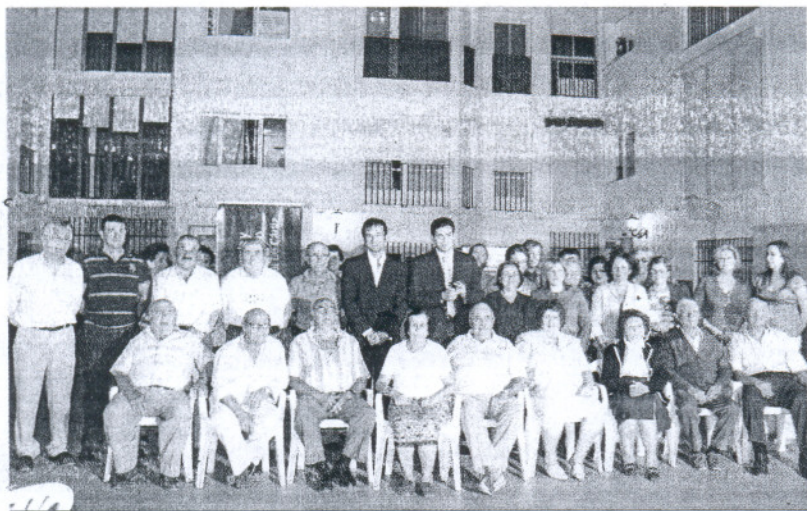
Autoridades y vecinos posan en la reinauguración del Edificio Príncipe de la Plaza de la Paz.