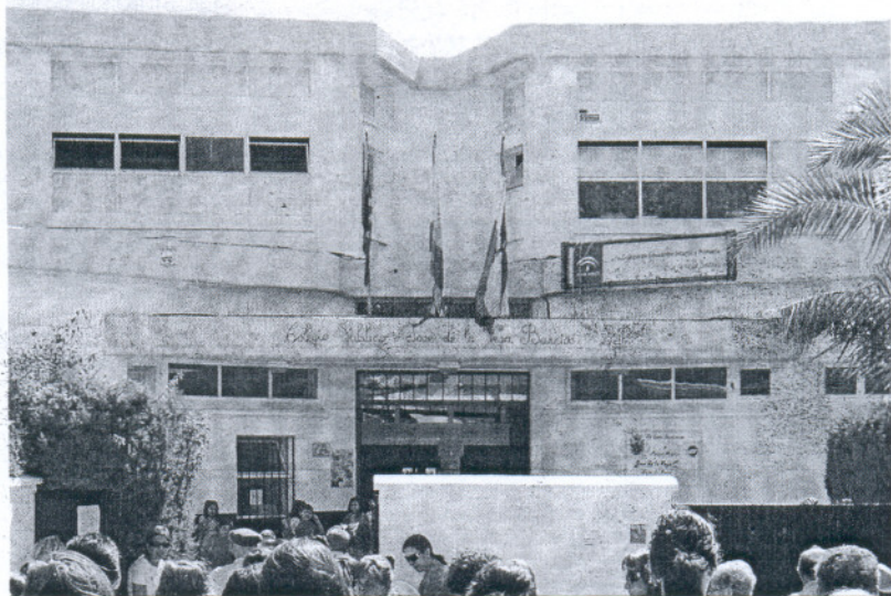
Fachada del colegio público de Chiclana José de la Vega Barrios.

Desde la Delegación Provincial de Educación desconocían ayer por la mañana la imputación del profesor del José de la Vega. Sí sabían de las denuncias que pesaban contra él, "que no se sustanciaron en su momento" pero que a pesar de eso, desde entonces "había sido apartado de sus labores docentes