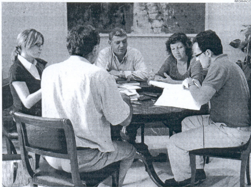
La edil de Medio Ambiente (d) y el delegado de Gobernación (c) estudiaron los criterios a valorar para la licitación.

herido en el año 2002 al Programa de Sostenibilidad Ambiental Urbana Ciudad 21, impulsado por la Consejería de Medio Ambiente y la Federación Andaluza de Municipios y Provincias (FAMP), a fin de mejorar la calidad de vida de los ciudadanos, mediante la implantación de medidas relacionadas con el medio ambiente