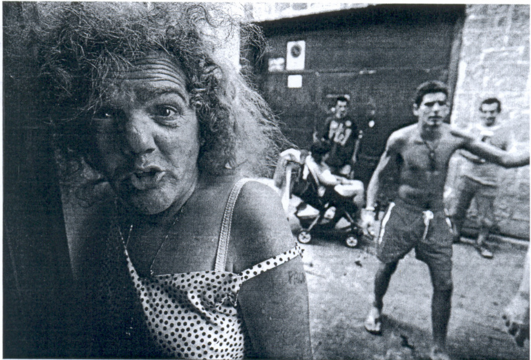
Una mujer en el acceso al comedor de María Arteaga de Cádiz, imagen de la ciudad más necesitada

El Ayuntamiento de Cádiz mantiene desde hace años una clara apuesta de apoyo social, con numerosos tipos de ayudas y subvenciones, a pesar de sus limitados recursos económicos. Para este año se contaba con un presupuesto de 2,6 millones de euros. La primera mitad del año fue tan