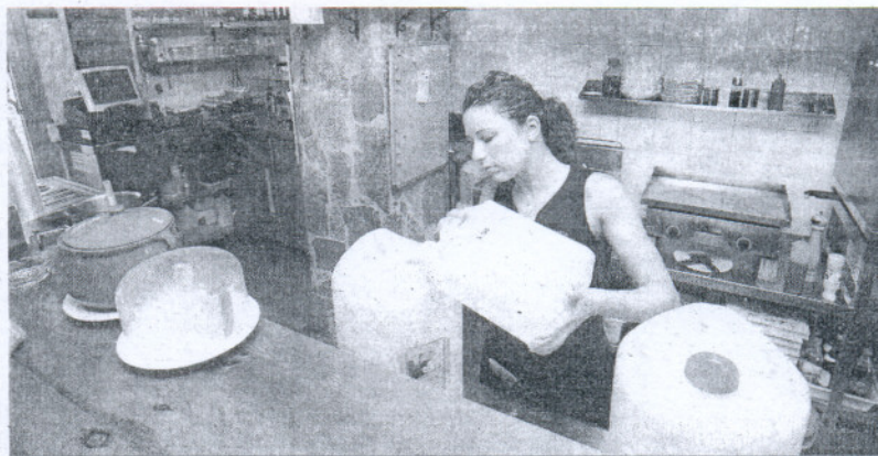
Los restaurantes, como esta pizzería, recurrieron los primeros días a las garrafas ante la falta de agua. BORJA BENJUMEDA

Este fue el tercer argumento esgrimido por el consistorio ante los cortes y el déficit continuado en el suministro que sufre el resort desde el viernes 7 de agosto. Anteriormente, el Ayuntamiento, a través del concejal delegado de Costa Ballena, Jesús Corrales, apuntó como primeras causas el consumo "desorbitado" registrado en los primeros días de agosto en la urbanización y el retraso de la Agencia Andaluza del Agua en