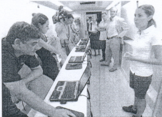
Interior del vehículo, que fue presentado ayer.

A través de esta campaña, la Consejería quiere desarrollar una