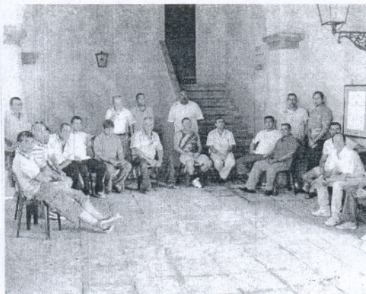
Los parados que permanecen encerrados en la Parroquia de la O.