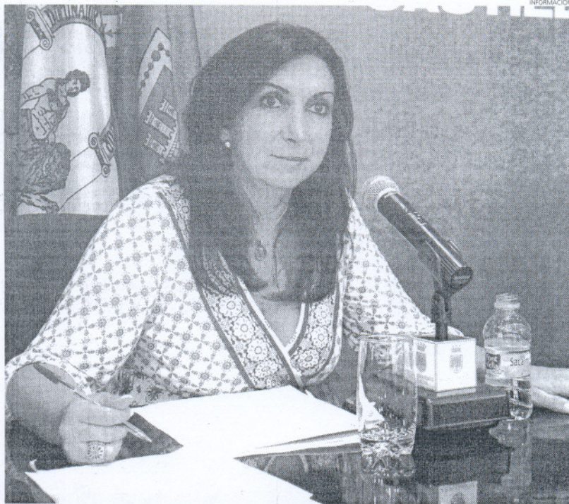
La portavoz del equipo de Gobierno rotero ha lamentado las críticas vertidas por Castillo y Vázquez sobre el tema.

Así, el portavoz del equipo de Gobierno insiste en que teniendo en cuenta que la infraestructura con la que contaba Costa Ballena, diseñada por la EPSA, no era suficiente, el Ayuntamiento suscribió en 2006 un convenio, en