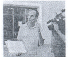
El portavoz de la FEN.

La FEN presenta su anuncio de recurso contra la ordenanza de playas