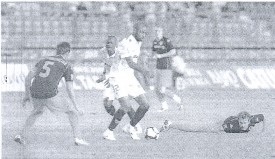
LV TROFEO CARRANZA

La Confederación de Empresarios señala también una ligera subida en el precio del suelo ofertado —PÁGINA 17—