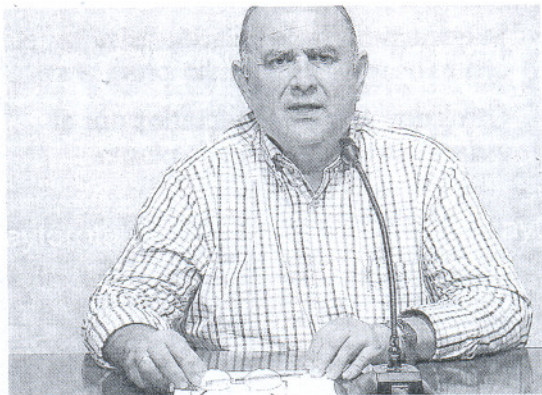
ANÁLISIS. Corrales señala a la Junta como responsable.

—Es un problema de consumo superior al que puede asumir, porque las tuberías fueron diseñadas para 20.000 personas y hay 35.000 residentes y los hoteles están a tope. — ¿Existiría este problema si estu-