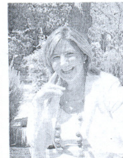
La alcaldesa de Sanlúcar.

Esto facilita que los ciudadanos que quieran llegar hasta el puerto no tengan que utilizar necesariamente el coche, que la conexión entre Bajo de Guía y Bo-