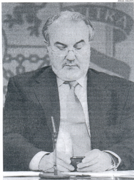
El vicepresidente segundo y ministro de Economía, Pedro Solbes.

La reducción de los intereses de demora supondrá un ahorro del 28,5% respecto a las tasas que