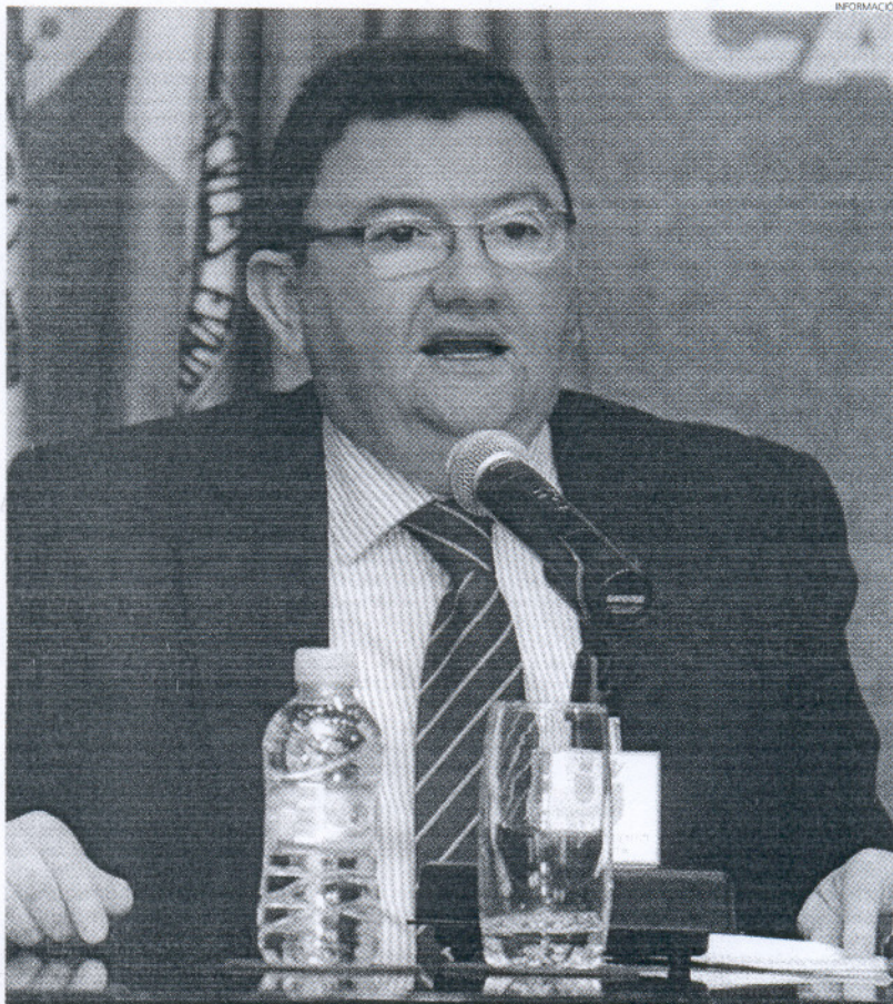
El alcalde de Rota ha recordado al enlace sindical de CCOO que no es su misión organizar la plantilla de la policía.