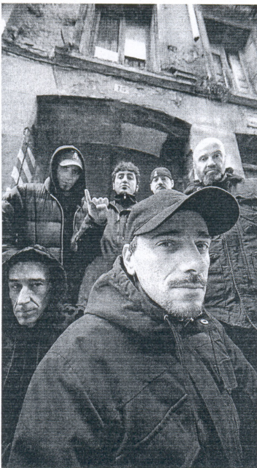
Los miembros del grupo Def con Dos.

Como buenos francotiradores contra los problemas de la sociedad dieron en el clavo. "Es lo que pasa, mientras exista un panora-