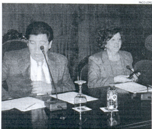
El alcalde y su Primera Teniente de Alcalde en su primer Pleno juntos.

En el texto aprobado por el Pleno se recuerda que "a España le queda mucho camino por andar para el cumplimiento de los acuerdos de Kioto". Se destaca que "el cambio climático constituye uno de los principales problemas a los que debe enfrentarse la humanidad en el siglo que empieza.