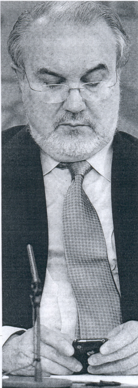
ATENTO. Pedro Solbes, ayer, en el Consejo de Ministros.

una vez iniciado éste. Para ello, la reforma establece garantías a favor de las entidades refinanciadoras, que pivotan sobre la no rescindibilidad de las operaciones no fraudulentas y la restricción de la legitimación para impugnar tales operaciones. La refinanciación deberá contar con el respaldo de tres quintas partes de los acreedores y la empresa tener un plan de viabilidad avalado por un informe indepen-