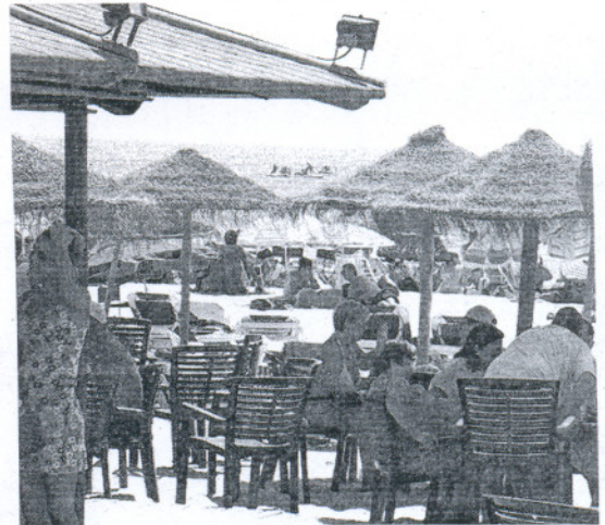
Los chiringuitos playeros están en peligro

Por otra parte la diputada del PP Celia Villalobos preguntará el miércoles en la sesión de control al Gobierno a la ministra de Medio Ambiente, Elena Espinosa, sobre la retirada de los chiringuitos porque, a su juicio, la Ley de Costas «no dice» que este tipo de establecimientos no puedan estar en la arena. «Cómo piensa resolver la Ministra de Medio Ambiente y Medio Rural y