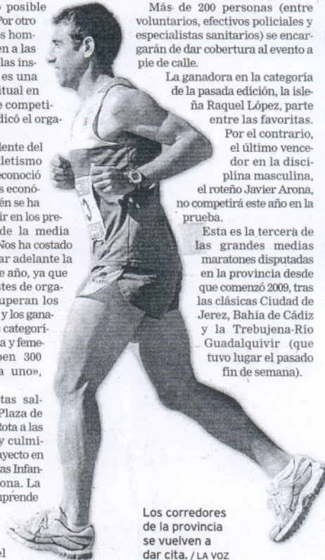
Los corredores de la provincia se vuelven a dar cita.

Esta es la tercera de las grandes medias maratones disputadas en la provincia desde que comenzó 2009, tras las clásicas Ciudad de Jerez, Bahía de Cádiz y la Trebujena-Río Guadalquivir (que tuvo lugar el pasado fin de semana).