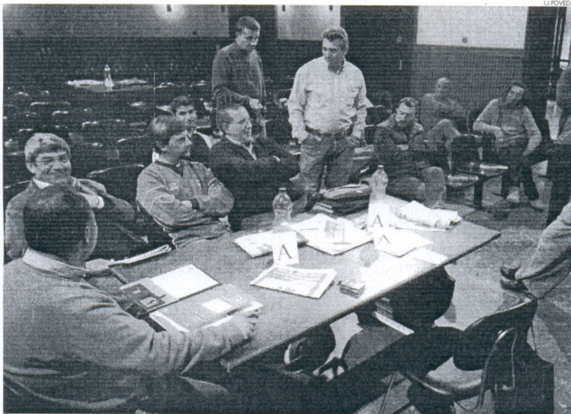
El colectivo de ex eventuales de Delphi lleva ya 26 días encerrado en el edificio de los sindicatos de Cádiz

La Consejería de Empleo manifiesta su "reiterada voluntad de diálogo cuantas veces sea necesaria y cada vez que se requiera por parte de UGT y CCOO, y confía en que las organizaciones sindicales, siguiendo su línea de conducta, propicien que el colectivo adopte posturas dialogantes y no