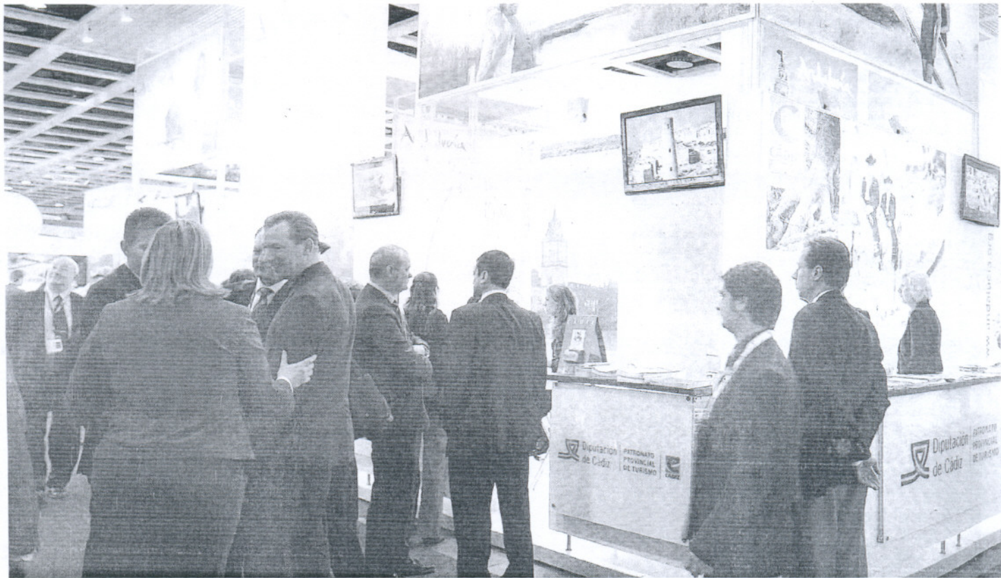
CONTACTOS. Mostrador de la delegación gaditana en Berlín donde se están llegando a acuerdos con mayoristas.