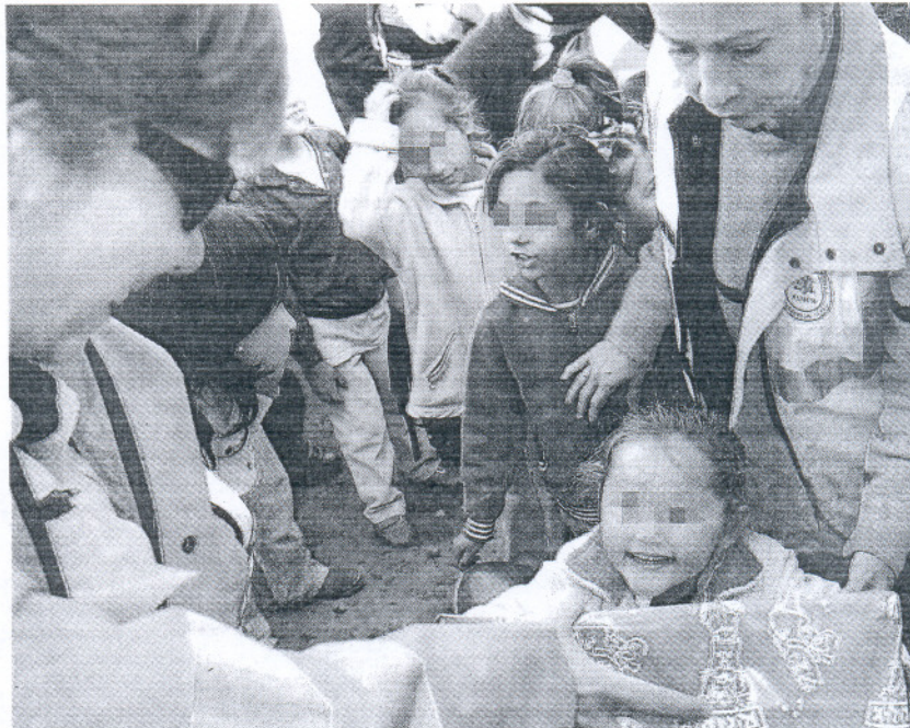
Un grupo de niños recibe ayuda de una entidad social

En definitiva, el trabajo diario con el entorno familiar es uno de principales ejes de actuación del programa. Este abordaje integral de la pobreza eleva a 61.732 el número de familias con los que trabaja el programa.