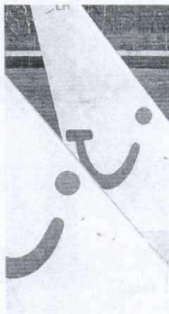
Aviones de TUI.

TUI centrará en la comunidad la principal acción promocional del grupo en el mercado alemán esta temporada, con una batería