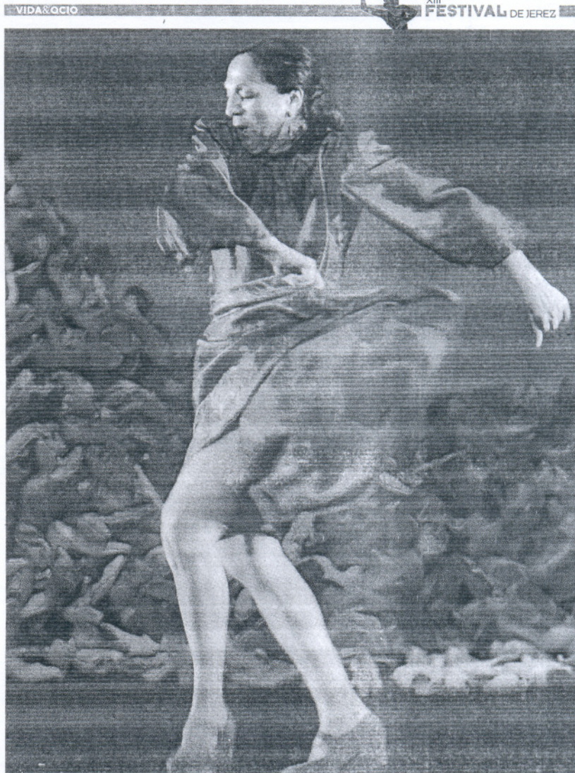
HOMENAJE. La veterana bailaora ideó un montaje inspirado en la obra del poeta granadino / J. FDEZ.

La Policía Local volverá a salir a la calle para exigir más medios y mejoras / 8