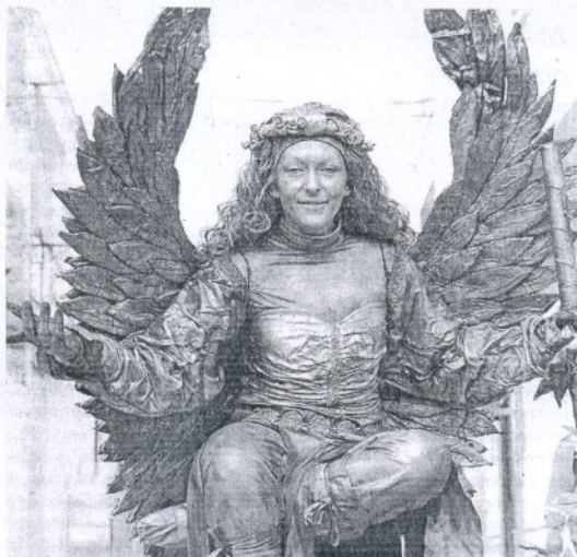
Una de las estatuas vivientes que han participado en el certamen.