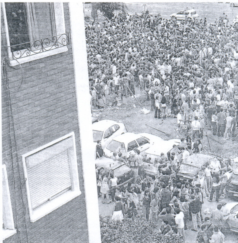
Un 'botellón', junto a un bloque de viviendas.

El reglamento da 15 días de plazo a los municipios para realizar la medición acústica tras una denuncia