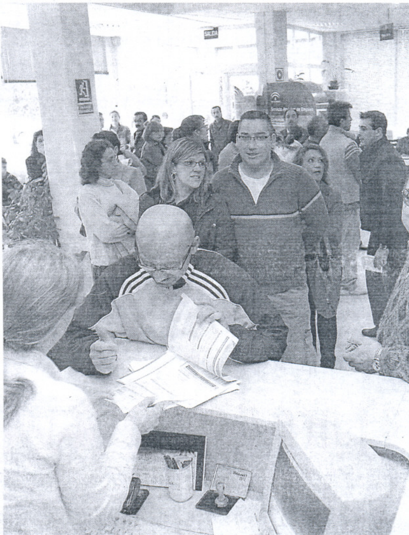
Colas en una oficina del Servicio Andaluz de Empleo de Chiclana el pasado mes de febrero.

De esos beneficiarios, 46.437 reciben la prestación contributiva, 30.738 el subsidio de desem-