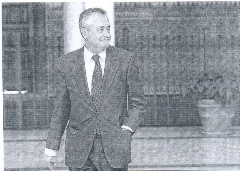
José Antonio Griñán camina por los pasillos del Parlamento andaluz.

Griñán trabaja desde el viernes en el discurso que pronunciará en el Parlamento con informes preparados por su equipo de la Consejería de Economía y con otros elaborados por distintos departamentos. Uno de sus colaboradores explicó que el texto final lo "está redactando él mismo y de su puño y letra". En éste desgana sus intenciones como presidente de la Junta y aportará su visión sobre Andalucía. Las propuestas a la sali-