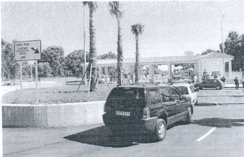
La compensación recibida este año es de nuevo de 250.000 euros, frente a los 500.000 recibidos en el año 2007.

La portavoz del equipo de Gobierno cree que el Gobierno de España "traiciona a los ciudadanos de Rota" y recuerda como el Ministerio de Defensa se ha eximido del asunto y ha sido el Ministerio de Administraciones Públicas, "el que para tapar la pisa y acallar las voces reivindicativas de Rota y de otras poblaciones, decide dar estas subvenciones". Unas subvenciones que en el 2007 comenzaron siendo de 500.000 euros y que ya el pasado año se vie-