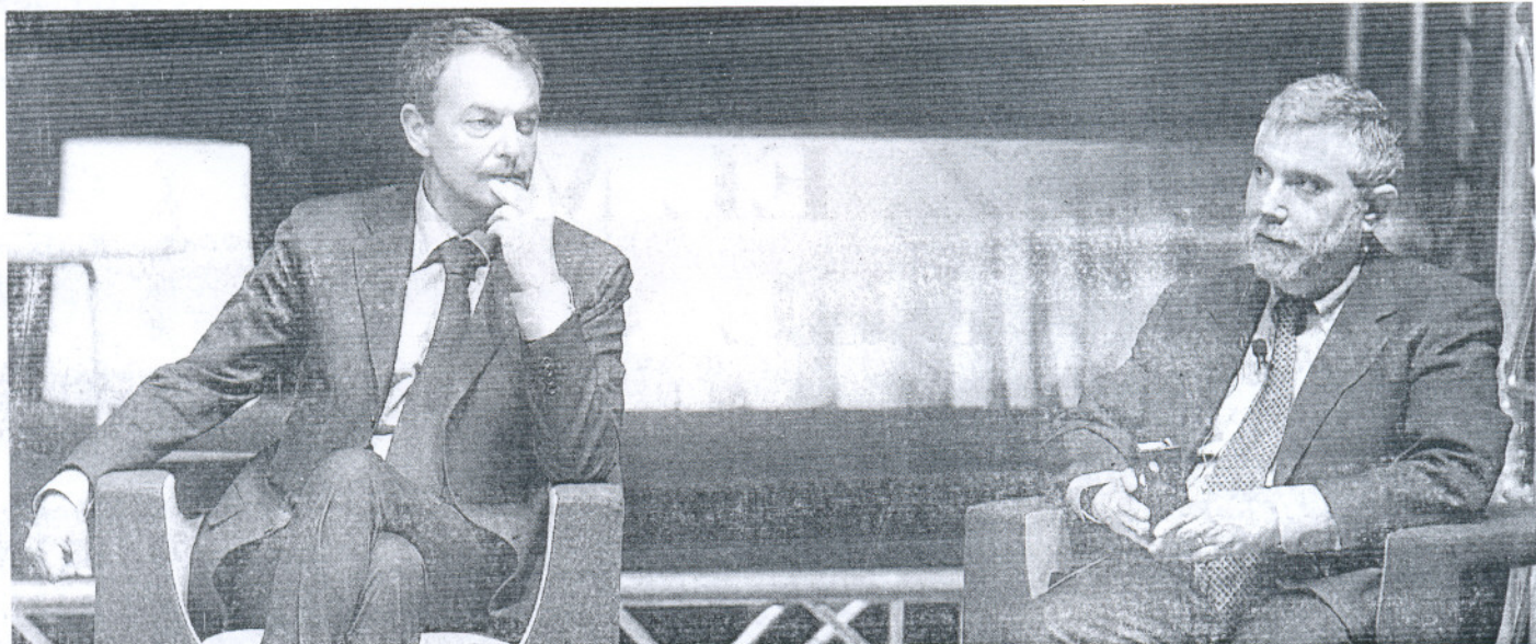
DIALOGO. José Luis Rodríguez Zapatero, acompañado de Paul Krugman, durante la jornada de ciencia e innovación celebrada ayer en Madrid.