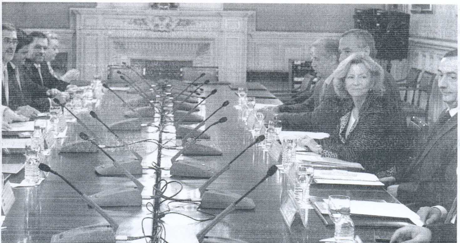
Bastaron cuarenta minutos para que los representantes de la Junta y el Gobierno central cerrasen el acuerdo sobre la Deuda Histórica

ma del actual sistema de financiación autonómica «no menos» de mil millones de euros. El acuerdo sobre financiación autonómica se formalizará cuando se constituya el Gobierno de Galicia, y sólo entonces será cuando se convoque el Consejo de Política Fiscal y Financiera (CPFF), aunque según la ministra de Administraciones Públicas, Elena Salgado, el acuerdo está «muy avanzado».