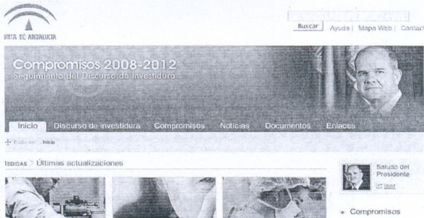
Web de la Junta donde expone los compromisos cumplidos.

En relación con la deuda histórica , se recoge que «incumplido el primer plazo fijado en el Estatuto de Autonomía, el Gobierno andaluz y