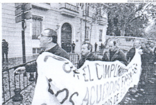
La protesta de los ex mineros de Boliden a las puertas de la Casa Rosa.