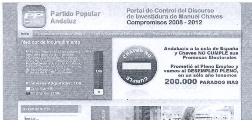
Web del Partido Popular andaluz donde describe los incumplimientos de Chaves.

el Gobierno de la Nación se fijaron otros seis meses para la cuantificación y el abono de la Deuda», mientras que la «falta de transparencia y el desconocimiento de los criterios seguidos por ambas administraciones para la cuantificación marcan el proceso de negociación» y la cuantía final «sigue sin ser conocida y además se ha ligado este asunto a la reforma del sistema de financiación», insisten. Si se accede a ( www.juntadeandalucia.es/com-