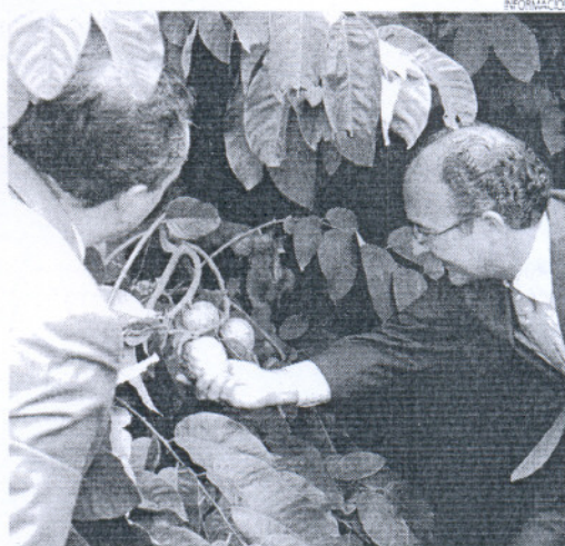
El consejero de Agricultura observa unas chirimoyas en su visita.