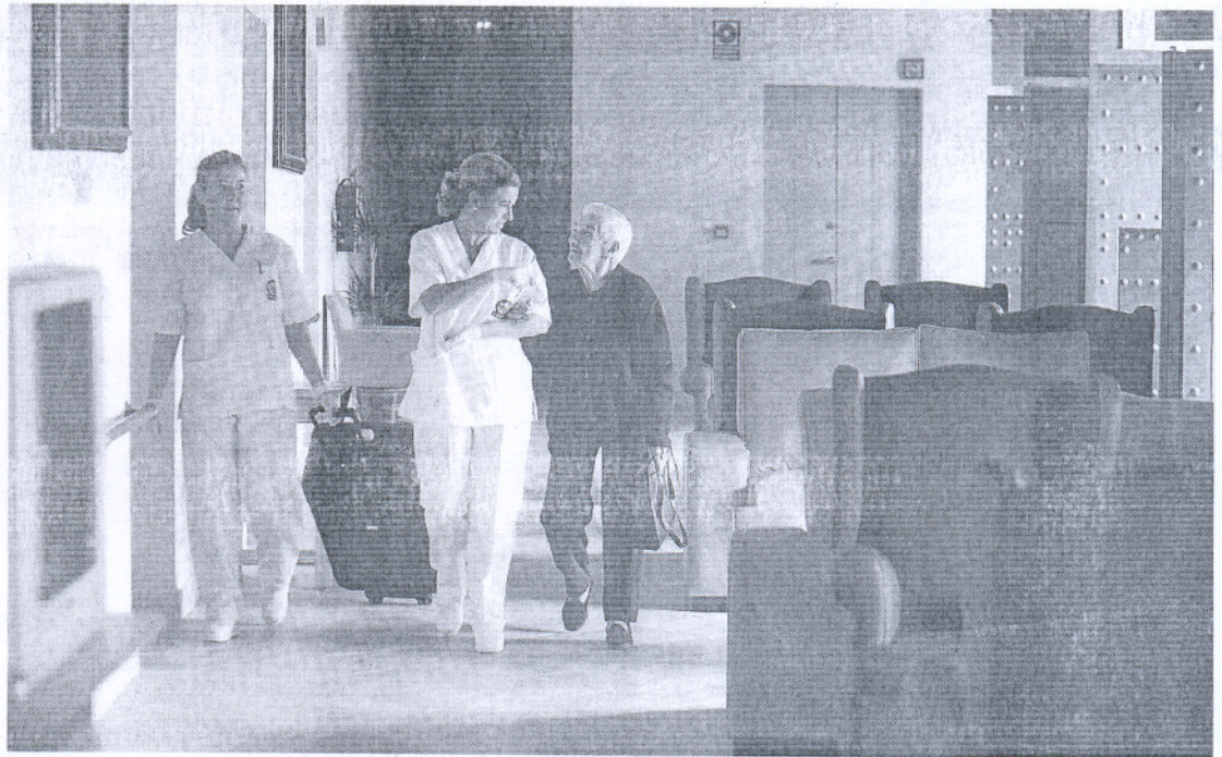
MÁS PLAZAS. Una de las ancianas de la Casa Viudas de Cádiz, tras la reforma de las instalaciones.

Hasta finales de año, los gaditanos habían presentado más de