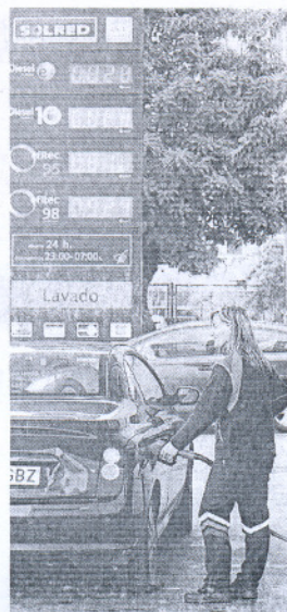
DIÉSEL. A la baja.

Productos como el gas se han abaratado en enero, mientras sube la luz