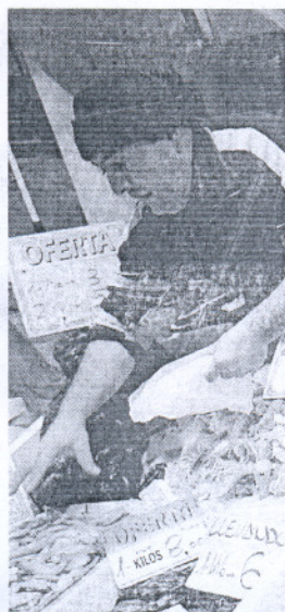
INFLACIÓN. En el 2,5%. / M. G.