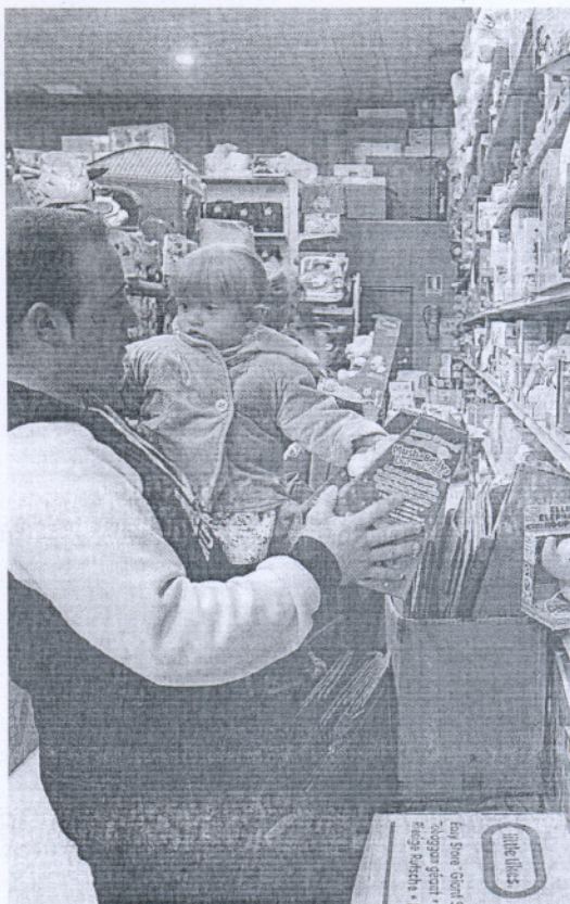
NAVIDAD. Un padre elige unos juguetes.

«Permite reducir la cuota en un máximo de un 50% hasta el 31 de diciembre de 2010», explica Arauz, que recuerda sin embargo, que a partir de 2011, las «cantidades que se han reducido, habrá que compensarlas mensualmente». Otras reducciones que se aplicarán este año, y que recuerda Arauz, es la bajada de dos puntos en el IRPF para las personas que estén pagando su vivienda. Ambas medidas, según Arauz, pueden al menos ser un buen recurso para «aliviar los bolsillos de las familias» en la primera recta del año, que se augura «dura».