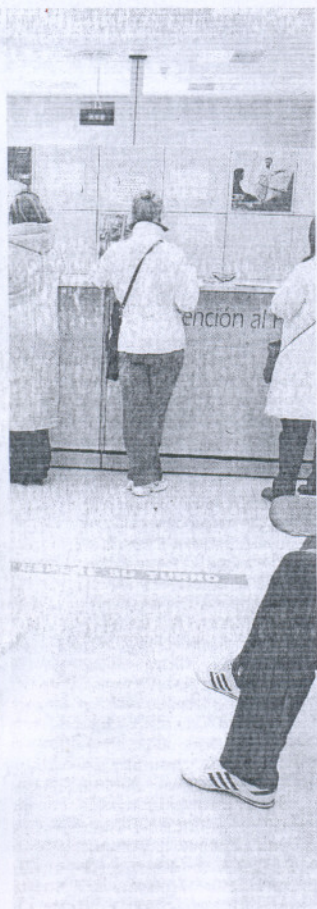
noticia económica. / A. V.