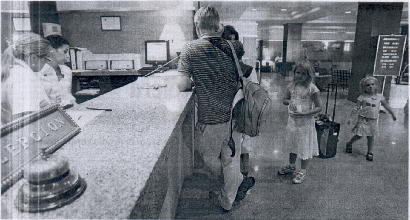
ESTANCIAS. El tiempo medio de alojamiento este mes de agosto no ha superado las tres noches por cliente, que solía reservar con muy poca antelación. LA VOZ