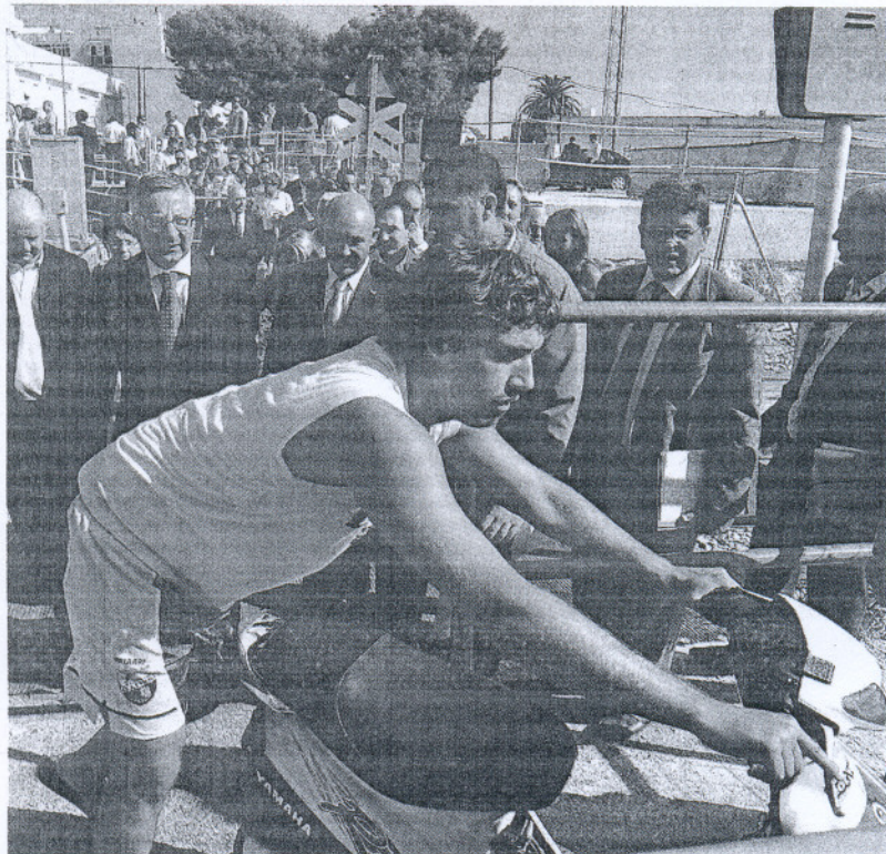
Blanco, en La Isla, tuvo que esperar en el paso a nivel con la gente que allí aguardaba para pasar.

Las nuevas infraestructuras garantizarán la conexión de Cádiz