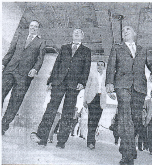
El ministro, con el alcalde isleño (a la derecha).