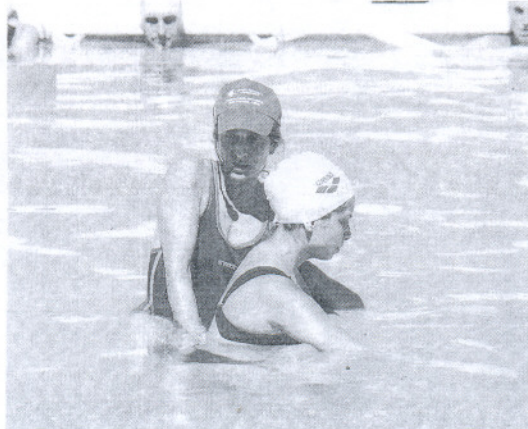
Las jornadas internacionales de hidroterapia serán a mediados de julio.

Un equipo de diez personas, entre profesionales del centro y voluntarios, ayudará a las tres federaciones españolas de deportes para discapacitados en la celebración de una competición en la que