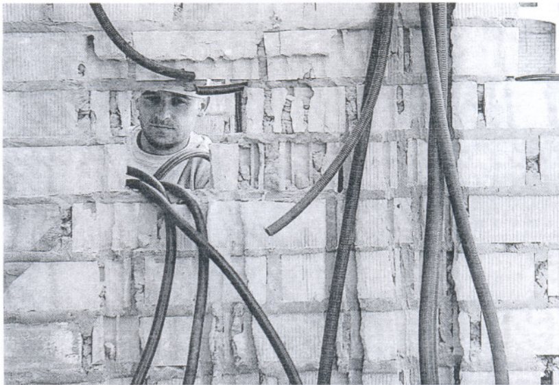
INVERSIÓN. La obra pública dejó en Cádiz adjudicaciones por 664,77 millones en 2008.