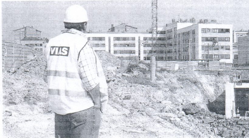
Un obrero observa las obras del túnel que unirá los barrios de Tremañes y La Calzada en Gijón

El programa, que según fuentes del sector podría llegar este mes o el siguiente, estará centrado en acelerar proyectos ya en marcha pero frenados por falta de dinero líquido y, de otra parte, en licitar nuevas carreteras y ferrocarriles con la ayuda financiera de las empresas. José Blanco ha advertido de que «no se trata de gastar más, sino de hacerlo mejor». Por eso, la idea pasa también por revisar el Plan Estatal de Infraestructuras del Transporte (PEIT), de la mano de las comunidades autónomas, para cribar pro-