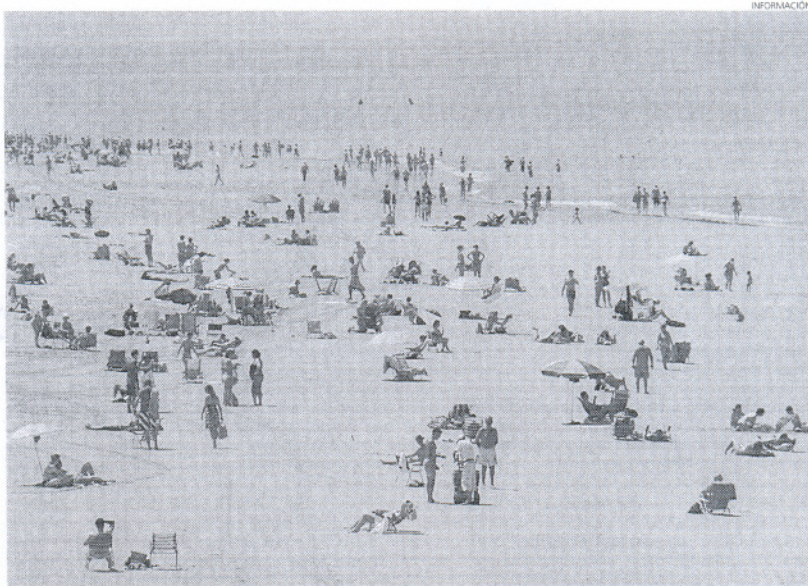
Imagen de la playa Victoria de Cádiz, una de las 52 que han sido analizadas en la provincia.

Las 52 playas de la provincia se reparten entre los municipios de La Línea (2), San Roque (5), Los Barrios (1), Algeciras (2), Tarifa (4), Barbate (5), Vejer (1), Conil (5), Chiclana (2), Cádiz (4), San Fernando (1), Puerto Real (2), El