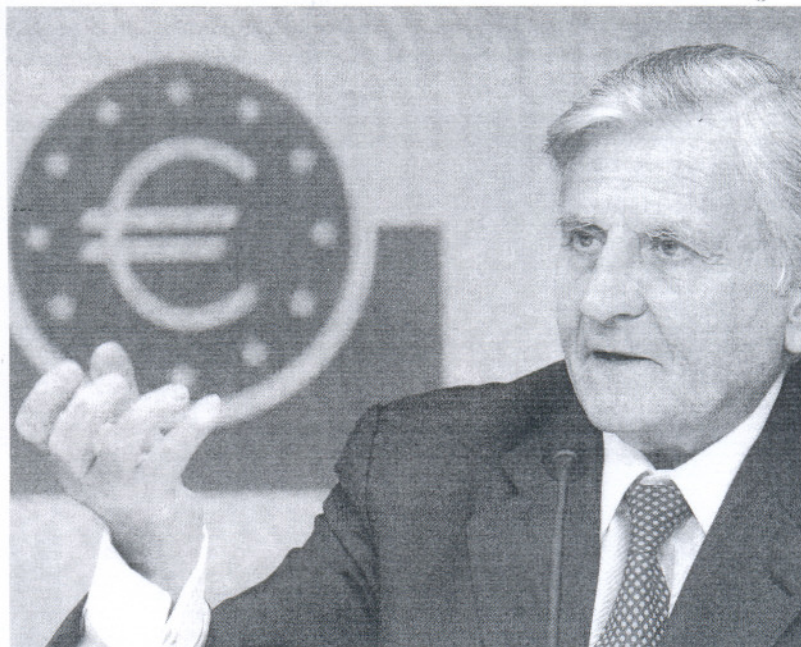
El presidente del Banco Central Europeo, Jean-Claude Trichet, en una comparecencia reciente.

El BCE señala que este escenario podría deteriorarse más aún si el impacto de las turbulencias financieras en la economía real es mayor de lo esperado, los mercados laborales se deterioran más, se intensifican las medidas proteccionistas o se produce una corrección desordenada de los desequilibrios globales. Por el contrario, hay algunos elementos que podrían mejorar las previsiones, desde un mayor impacto de los estímulos fiscales adoptados,