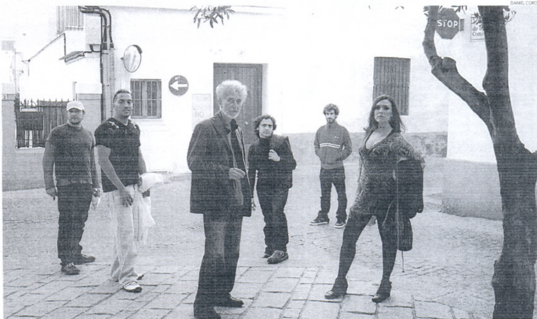
La Hoguera, en una de las calles de Rota, vienen dispuestos a ofrecer la química que existe entre sus componentes cada vez que tocan juntos.

—Te adelantamos que vamos a hacer todas canciones nuevas. Son las que estamos grabando en el