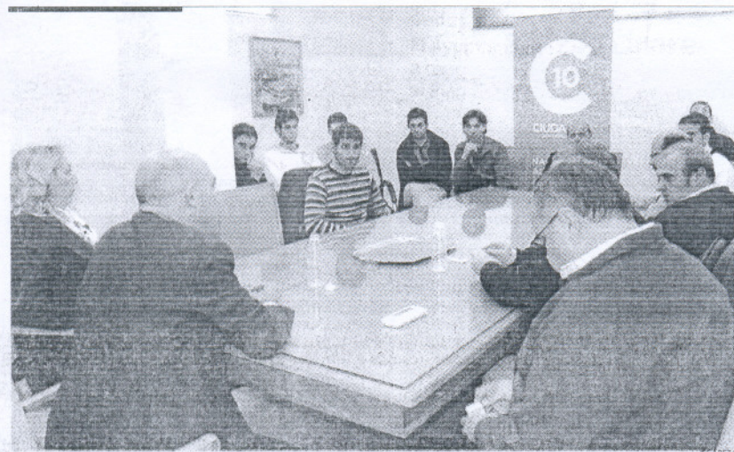
CD SAN FERNANDO