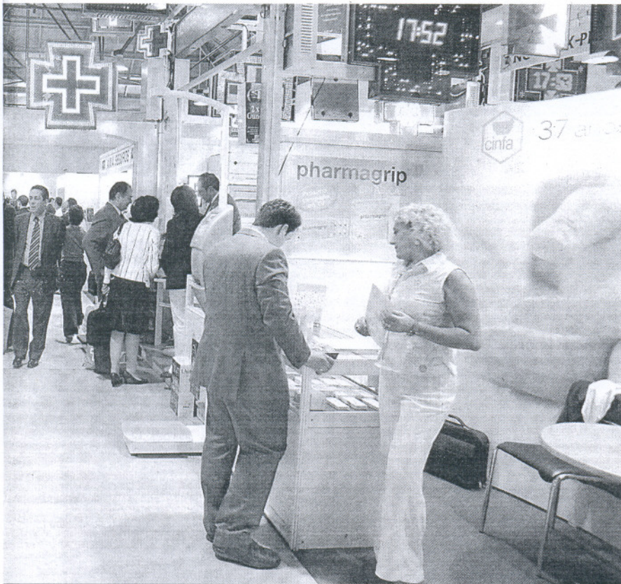
Imagen de una de las convenciones del sector sanitario celebradas en el Palacio de Congresos de Cádiz.

La exposición del PGOU, abierta durante el periodo de alegaciones, ha recibido en un mes más de 1.500 visitas