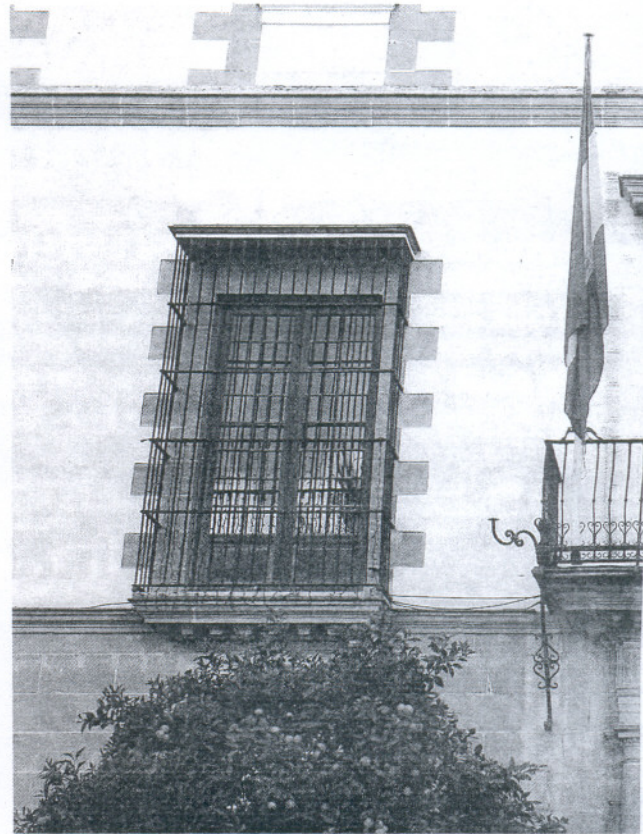
Fachada del Ayuntamiento de El Puerto de Santa María.