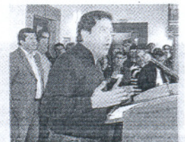
Barroso sí tuvo público esta vez.

Barroso vuelve a cargar contra el Rey un año después en el mismo escenario