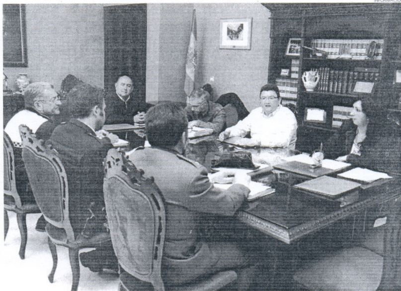
El alcalde ha trazado el plan de seguridad que cada año se establece para garantizar una feria sin incidentes.

Corrales solicitó una vez más la colaboración de todas las entidades y peñas, para que las casetas de la localidad sigan manteniendo los niveles sanitarios e higiénicos