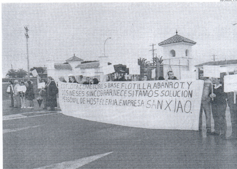
Los empleados de San Xiao han comenzado cortando el acceso a la Base, pero no descartan cortar la carretera.

Por otro lado, la única propuesta que llega desde la base es que "se puede hacer renunciar a la empresa a la concesión del servicio, pero siempre que la entidad