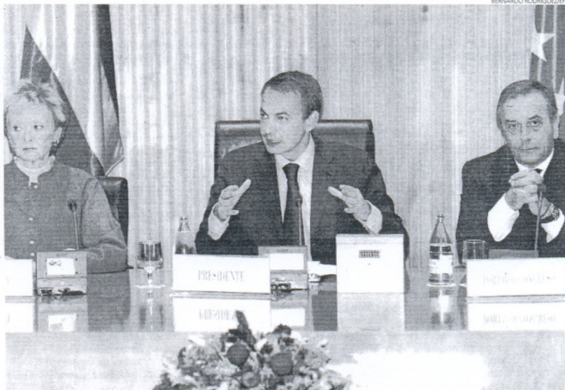
José Luis Rodríguez Zapatero (c), junto a María Teresa Fernández de la Vega, y José Antonio Alonso.

"Lo vamos a hacer cada día mejor, lo vamos a hacer bien, y además las cosas van a salir bien", subrayó el presidente, antes de com-