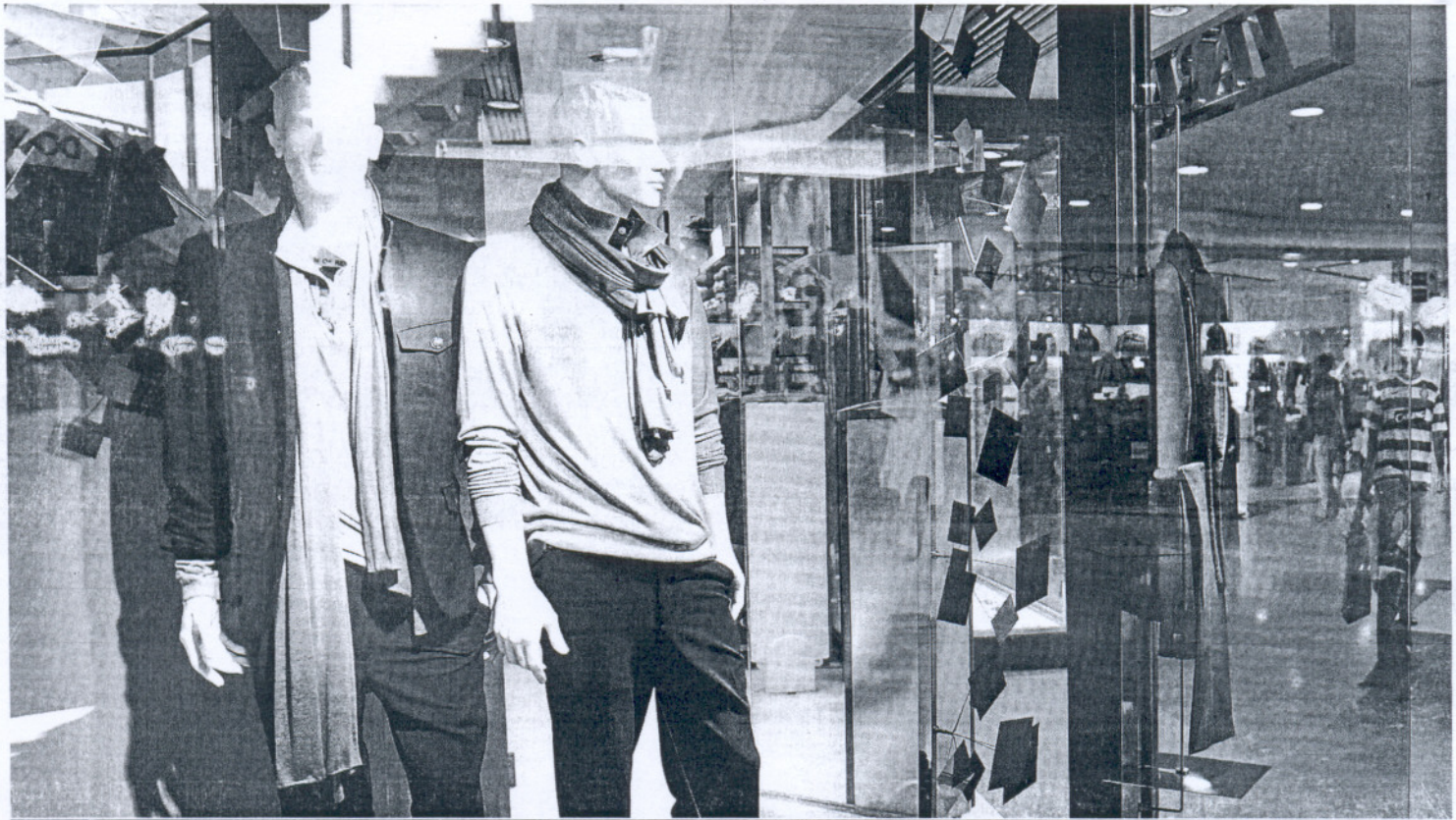
Pasillos del centro comercial Bahía Sur, uno de los grandes complejos comerciales y vanguardistas de la provincia.

REFORMA EN EL SECTOR SERVICIOS Adaptación a la 'Directiva Bolkestein' de la UE