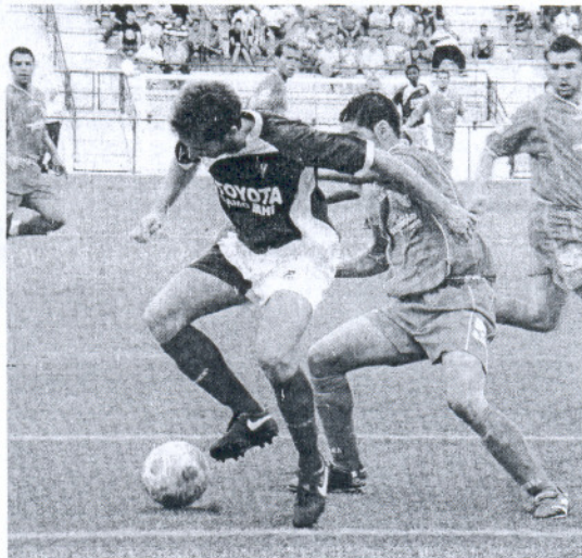
Rodiel ha recaído de su lesión y no podrá jugar ante los azulinos.

Por lo demás, pocos cambios con respecto al equipo habitual del cuadro azulino que pondrá la línea de cuatro en defensa, con Castillo y Juanje en los laterales y Chiqui Paz y Capi como centrales. Por delante estará la línea de tres formada por Reque, Natera y Raúl Silveira, para dejar una banda a Prince y la otra a Puli, jugando en