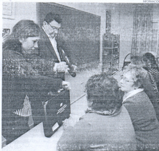
El alcalde y la delegada repartieron las carpetas entre los alumnos.

Así, el alcalde subrayó el espíritu de superación de las personas que en su edad adulta acuden a este centro para ampliar su formación, y animó a todos los alumnos a aprovechar esta etapa educativa, que resulta una experiencia muy interesante para el ampliar conocimientos y potenciar las relaciones personales.