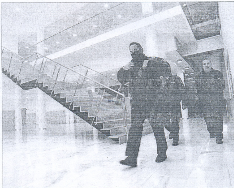
Un aspecto del interior de la nueva comisaría central de Granada.

Las dependencias de Vélez Málaga también cosechan críticas por viejas y reducidas. "Es antigua y poco preparada", comenta