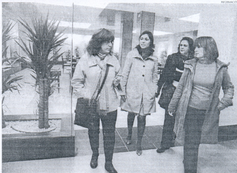
Las representantes de la asociación conocieron las instalaciones y aquellas salas de las que podrán disponer.

La delegada de Participación Ciudadana recordó que ya se han