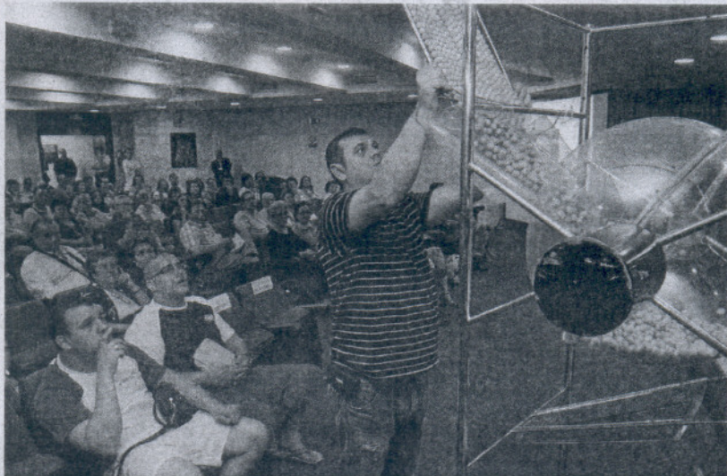
Sorteo de una promoción de VPO en Córdoba, en junio de este año.

Esta medida se engloba dentro de un conjunto de modificaciones que estarán vigentes durante 2010 y que, según el Gobierno, persiguen "facilitar el acceso a más familias a viviendas asequibles y ampliar el parque de vivienda protegida en compra y en alquiler aprovechando el excedente de viviendas libres".