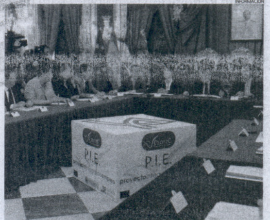
Imagen del acto celebrado este viernes en la Diputación.

El 60 por ciento de las personas beneficiarias son mujeres. El PIE se destina a colectivos que sufren mayores dificultades para acceder al mercado de trabajo; de hecho la mayoría de los destinatarios vive en circunstancias cercanas a la exclusión social. Discapacitados, ex reclusos, minorías étnicas, víctimas de malos tratos, personas que han superado alguna drogadicción... son destinatarios de una actuación que permite abrir una puerta hacia el empleo.