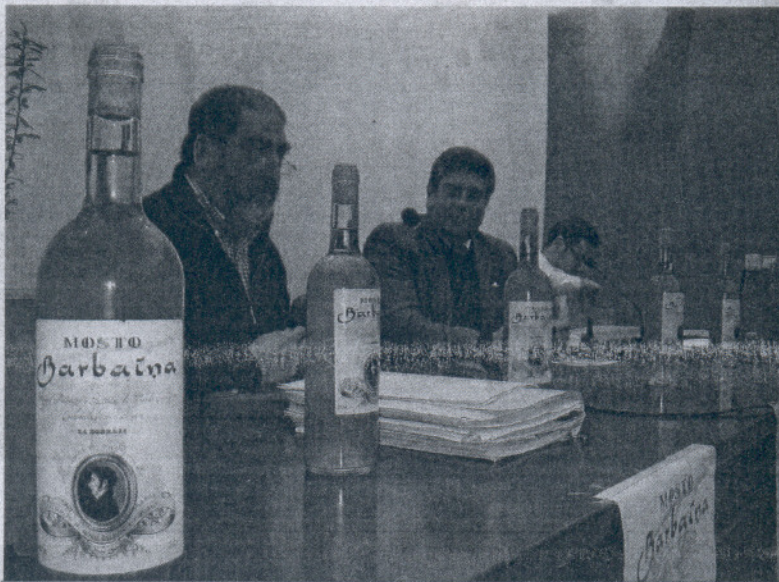
El acto público de presentación del mosto Barbaína se celebró en la Biblioteca Municipal 'Rafael Pablos'.

Por otra parte, el PA ha lamentado que "sólo AS" haya respondido a su propuesta de que los grupos políticos del Ayuntamiento destinen esta Navidad a "las familias más necesitadas" los 17.000 euros que les corresponden en total por el mes de diciembre, sumando a esa cifra una aportación idéntica del Consistorio.