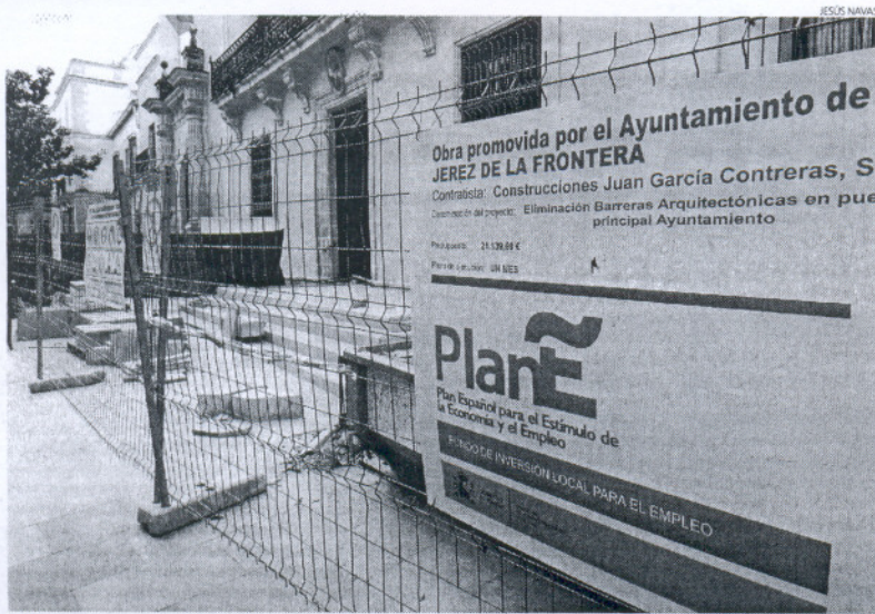
El Plan E ya ha generado más de 11.000 empleos en la provincia de Cádiz.