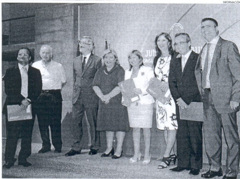
La Consejería de Agricultura y Pesca presentó ayer la inversión en los GDR de la provincia de Cádiz.

En el caso de las comarcas rurales gaditanas, los GDR se plantean como objetivo general de sus