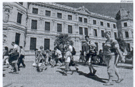
Turistas visitan la Real Escuela Ecuestre de Jerez.