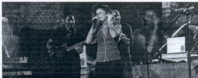
DUENDE. La Mari de Chambao fue la encargada de poner la voz a la entrega de los premios.

El presidente de la Junta valoró el papel de los medios en la Andalucía del futuro