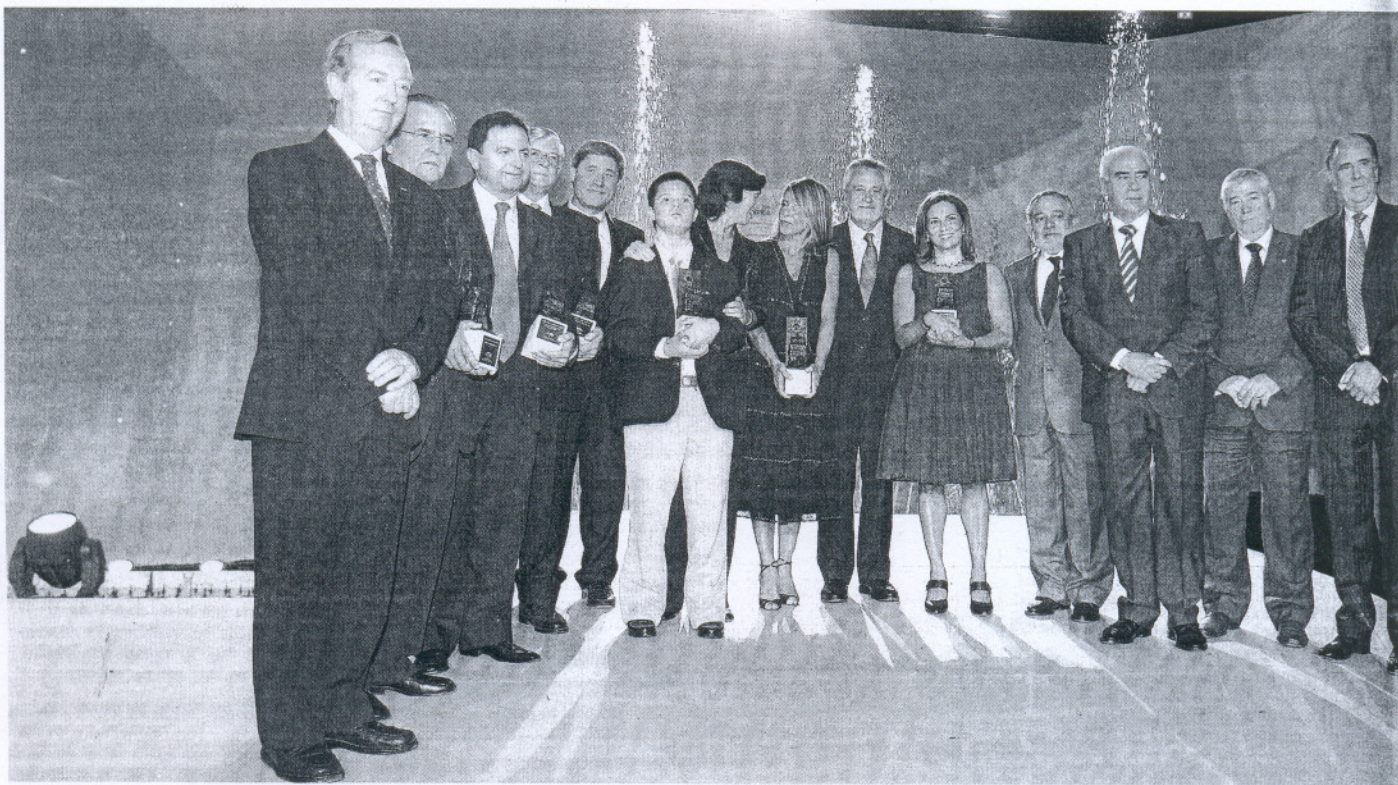
GALARDONADOS. Fotografía de familia en la que posan todos los homenajeados tras la ceremonia de entrega de los premios en los jardines del Alcázar de