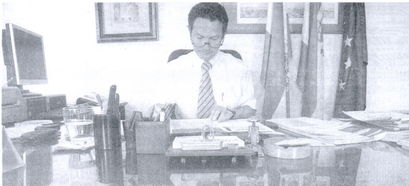
PAPELES. El nuevo delegado de Justicia atiende varios asuntos en la mesa de su despacho de la calle Nueva, en Cádiz.