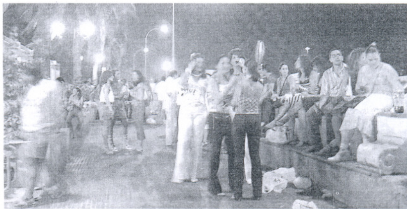
PROTESTA. Un grupo de jóvenes hace botellón en la ciudad. / L.V.

El Ayuntamiento ha propuesto llevárselo a la zona de la Feria Afirma que sufren numerosos actos vandálicos cada semana