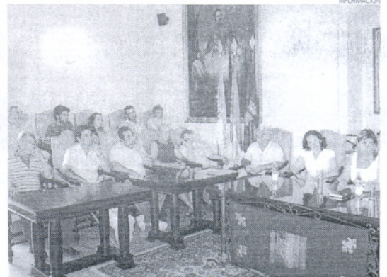
El Ayuntamiento concretó con los flamencos los próximos eventos.