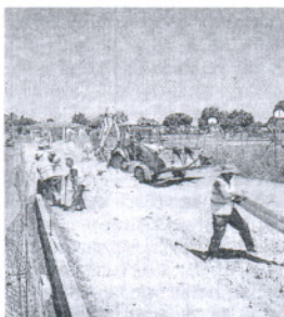
Obras del carril bici.

El nuevo carril bici, de 850 metros, rodeará El Manantial y