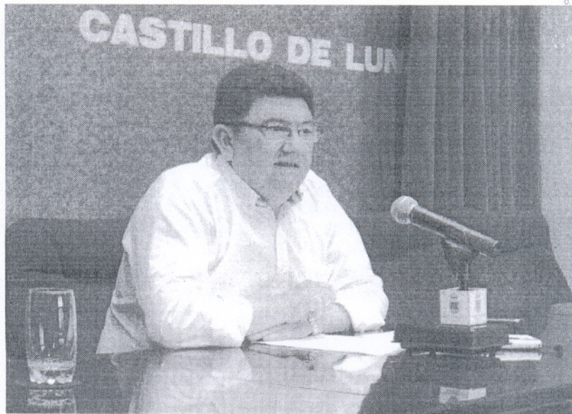
El alcalde ha dado cuenta de la sentencia que favorece el avance de un proyecto contemplado en el PGOU.

Así, tras iniciar el procedimiento necesario para la conexión de Calderón de la Barca, y después de las gestiones realizadas en este tiempo en las que no han faltado dificultades de entendimiento con algunos vecinos, esta sentencia favorable al Ayuntamiento, hará posible que en breves fechas el Consistorio pueda sacar a licitación el tramo de calle que conectarán Calderón de la Barca con Calvario, ofreciendo la posibilidad del tránsito peatonal entre ambas vías.