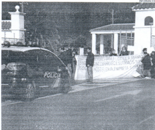
Los trabajadores del servicio de hostelería de la Base, ayer.

desde hace dos meses. Por un lado, que la empresa negocia con los bancos un crédito para poder abonar los salarios que adeuda a la plantilla y, por otro, que existe una segunda firma interesada en hacerse cargo de la concesión del servicio. En este último caso la plantilla actual tendrá que renunciar a sus demandas aunque tendrían garantizado, en principio, el puesto de trabajo. Los empleados de San Xiao no confían en esta última solución y no están dispuestos a firmar acuerdo alguno hasta que cobren el dinero que se les adeuda.