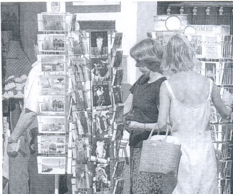
TURISTAS. Unos visitantes ojean un expositor de postales.