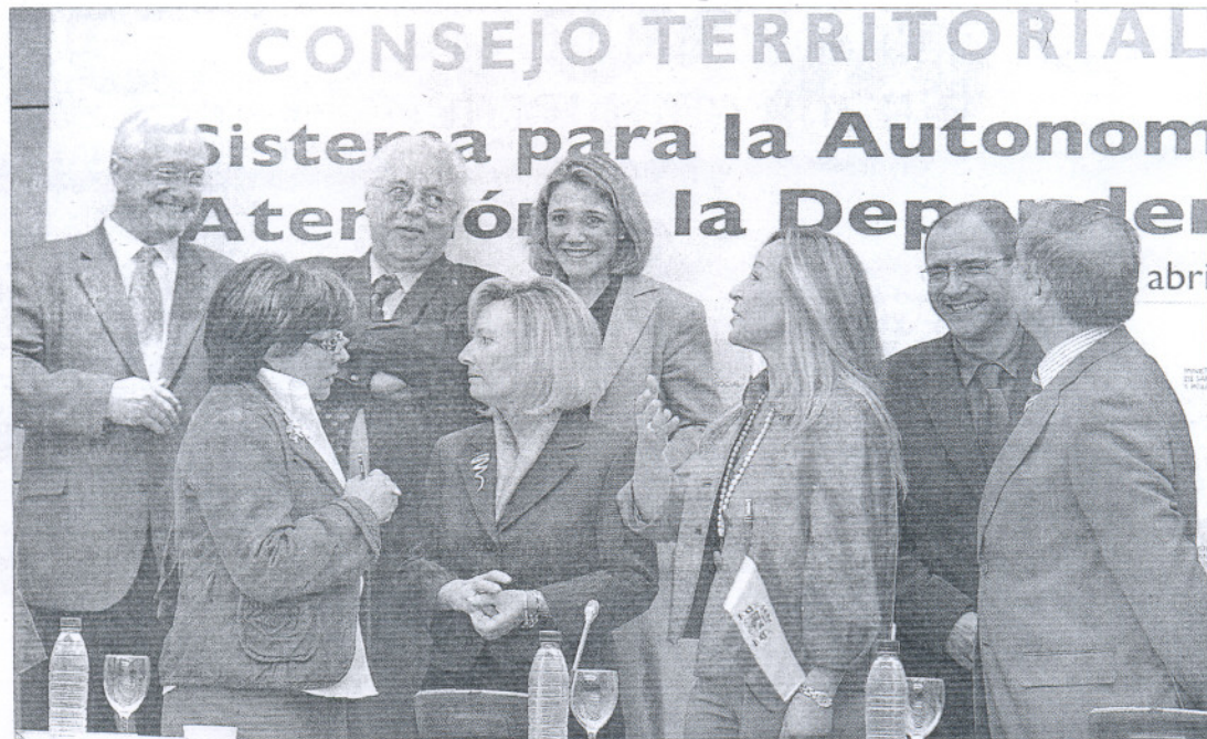
Trinidad Jiménez, de rojo, en la foto de familia de su primer Consejo Territorial sobre Dependencia.