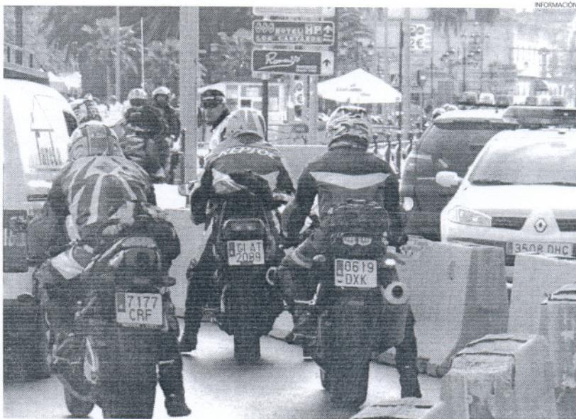
El dispositivo de la Motorada comenzará a aplicarse el jueves 30 de abril.

En principio estaba previsto que los policías que trabajen en el dispositivo de la Motorada lo hicie-