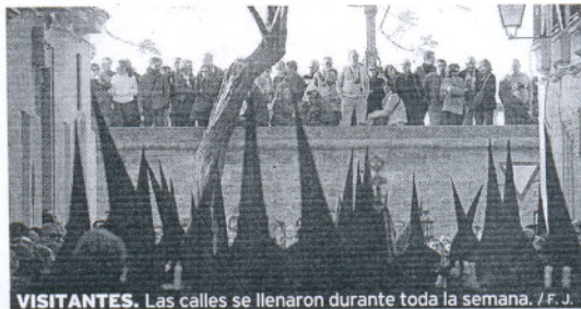
VISITANTES. Las calles se llenaron durante toda la semana.

un 89%; y la de la Costa del Sol, en Málaga. A nivel nacional, la ocupación media de los hoteles durante las vacaciones de Semana Santa se situó en cerca del 75%, lo que supone un descenso de diez puntos porcentuales, debido a la crisis económica y al mal tiempo, según la Cehat. La actual coyuntura afectó a la estancia media y a los precios, que se rebajaron un 10% en comparación con la Semana Santa del año pasado.