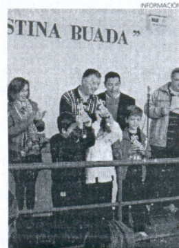
Entrega de premios.

También se disputaron premios especiales, como el destinado al centro escolar que aportase más participantes, que constaba de un lote de material escolar con el que fue galardonado el colegio de los Salesianos; el premio al participante de más edad; el premio