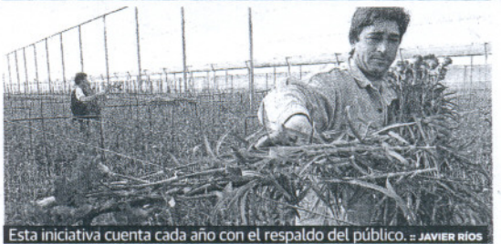
Esta iniciativa cuenta cada año con el respaldo del público. de JAVIER RÍOS