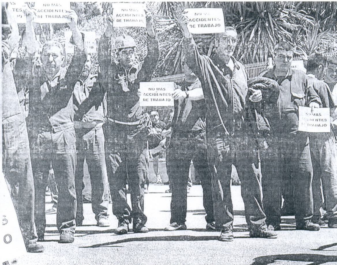
Protesta en contra de la siniestralidad laboral.

CONSTRUCCIÓN La caída de la edificación también influye porque ha propiciado una importante reducción de la siniestralidad laboral