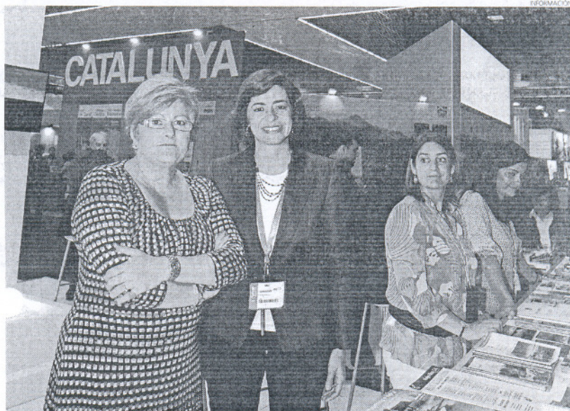
La localidad ha hecho uso de esta oportunidad para seguir dando a conocer su propuesta al turismo vasco.

Además a través de la Fundación de Turismo también están representadas mediante diverso material promocional las principales empresas turísticas de la ciudad, desde establecimientos ho-