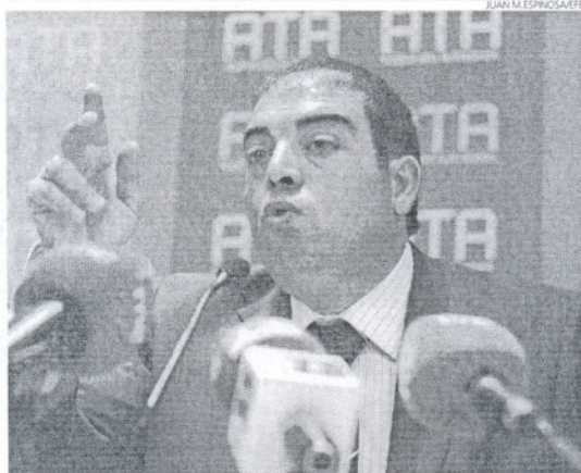
El presidente de la Federación Nacional de ATA, Lorenzo Amor.

ca, los autónomos propiamente dicho (aquellos que no tienen forma de sociedad) encuentran dificultades de financiación en el 91,5% de los casos, mientras que el porcentaje es del 85,9% entre los autónomos con personalidad jurídica.