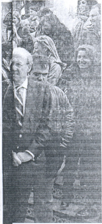
J. M. SERRANO

Todas estas cuestiones a las que deben hacer frente los municipios, relata la parlamentaria, han convertido en «pedigüeños» a los ayuntamientos que deben «rogar» dinero a las administraciones para poder dar servicio a sus ciudadanos.