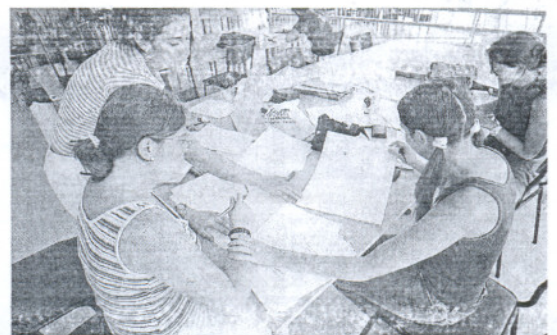
Varios universitarios estudian una de las asignaturas.

procesos educativos del sistema universitario. «Esta fundación evalúa el número de años que tardan los alumnos en terminar la carrera, la tasa de abandono o los niveles de satisfacción registrados en las encuestas de calidad», recalzó el rector. La calidad en el doctorado fue otro de los aspectos en los que destaca la UCA.