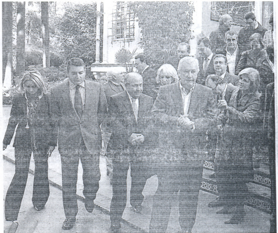
Arenas tras una reunión con alcaldes populares, en una imagen de archivo

La sustitución, en la reciente crisis de Gobierno, de Clara Aguilera por Luis Pizarro al frente de la Consejería de Gobernación ha supuesto un «frenazo», en opinión del PP, para el desarrollo de las leyes que deben permitir una mayor autonomía de los ayuntamientos. «Con Clara Aguilera era inminente», relata la diputada Carmen Crespo, quien recuerda que en marzo se aprobó en el Parlamento la creación de un grupo de