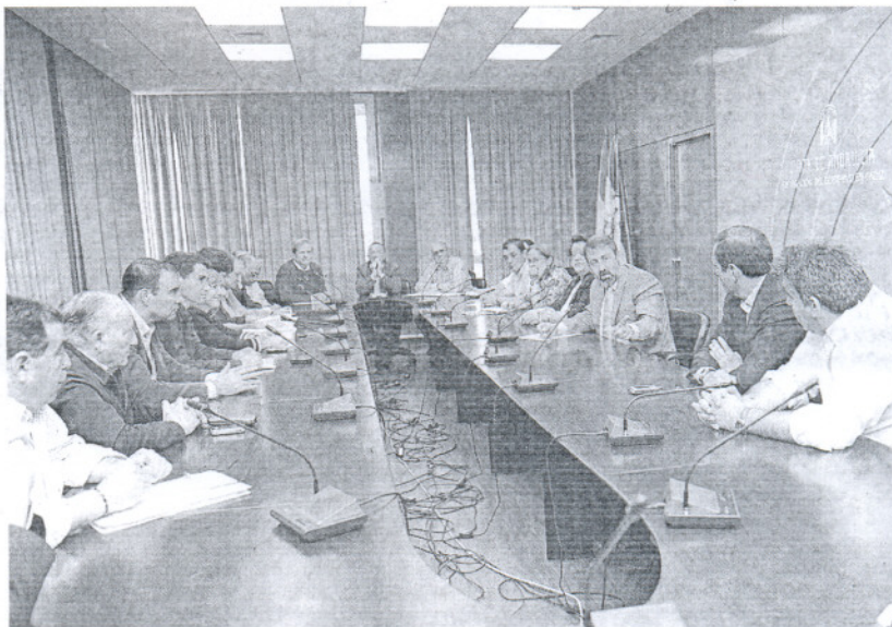
Alcaldes y concejales durante la reunión de ayer con el delegado de la Junta en Cádiz.

Algunos ayuntamientos ya han avanzado sus planes municipales, caso de Chipiona y Chiclana, y el objetivo es llegar al verano con los deberes hechos. La Junta está dispuesta a poner al servicio de las corporaciones locales a la Policía Autonómica y a la Guardia Civil para reforzar las labores de inspección y las actuaciones de la Policía Local. Los cálculos más conservadores de Ecologistas en Acción apuntan a un contingente de 40.000 viviendas ilegales en la provincia y Chiclana, con 20.000, y El