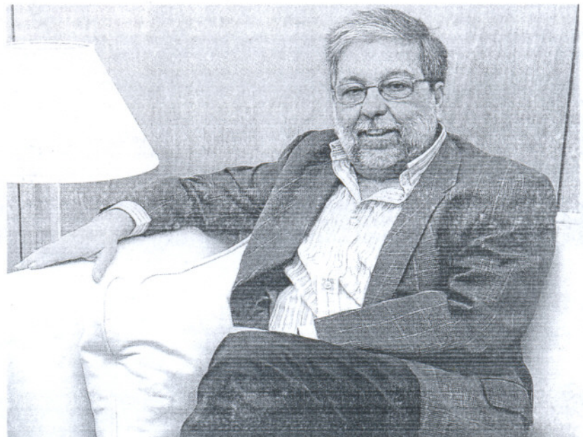
Francisco Toscano, presidente de la Federación Andaluza de Municipios y Provincias (FAMP)