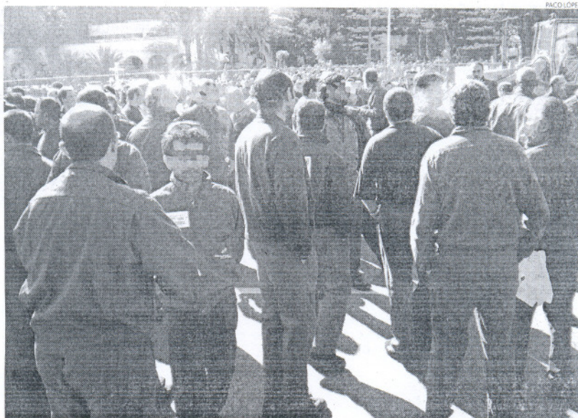
Casi 4.000 trabajadores se han visto afectados por expedientes de regulación de empleo en lo que va de año.

A nivel andaluz, el número de expedientes de regulación de empleo autorizados ascendió en los tres primeros meses de 2009 a 327, lo que supone más del triple de