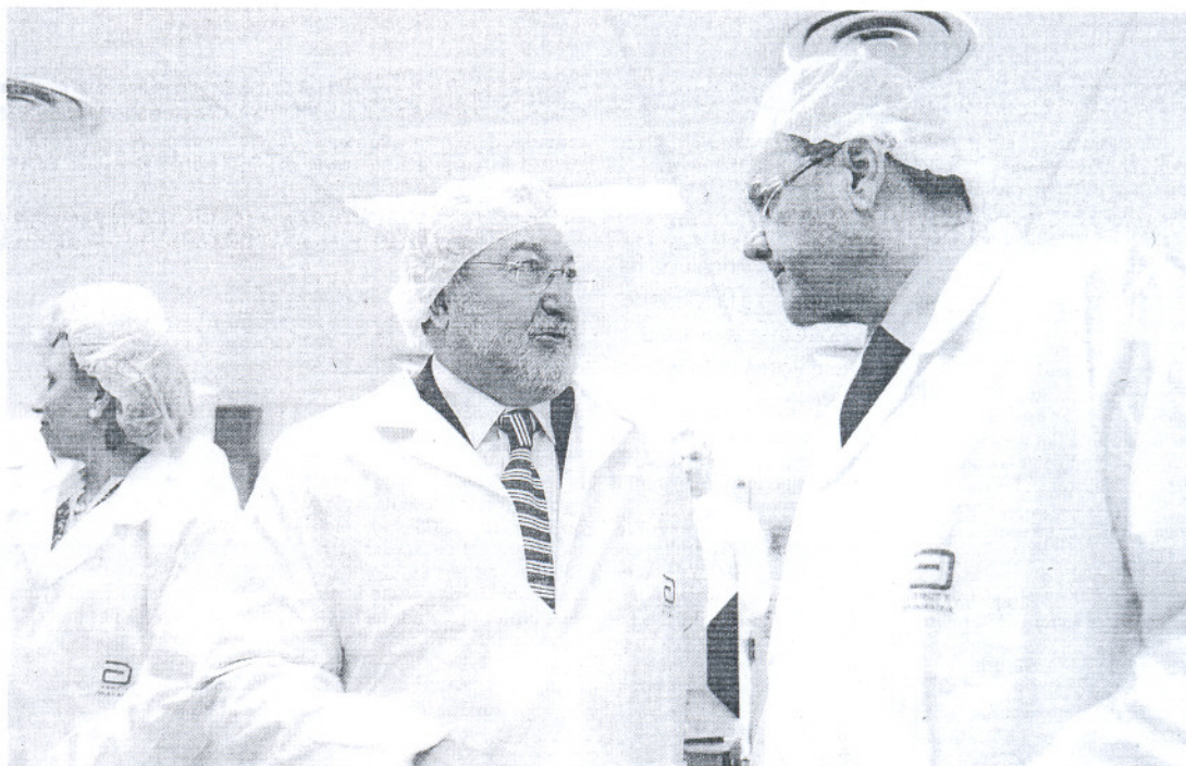
Bernat Soria, ministro de Sanidad, y Manuel Chaves conversan en la inauguración de la ampliación de unos laboratorios, ayer en Granada. MIGUEL RODRIGUEZ

La cifra tabú para el empleo andaluz está hoy más próxima que ayer: el millón de parados puede ser una realidad en meses. De "hipótesis real" lo definió ayer el presidente de la Junta de Andalucía, Manuel Chaves, atisbando los peores pronósticos. El desempleo en la comunidad se eleva a 744.956 andaluces, 25.578 personas más en las colas del Inem en enero (+3,56% respecto a diciembre). El pronóstico de la Junta de 120.000 parados más en todo este año ya acumula un 20% en sólo el primer mes. A pesar de que el ritmo de crecimiento es inferior a la media nacional en términos relativos, la cifra próxima de un