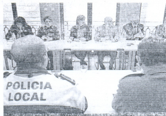
Un momento de la reunión que se celebró ayer en Subdelegación.