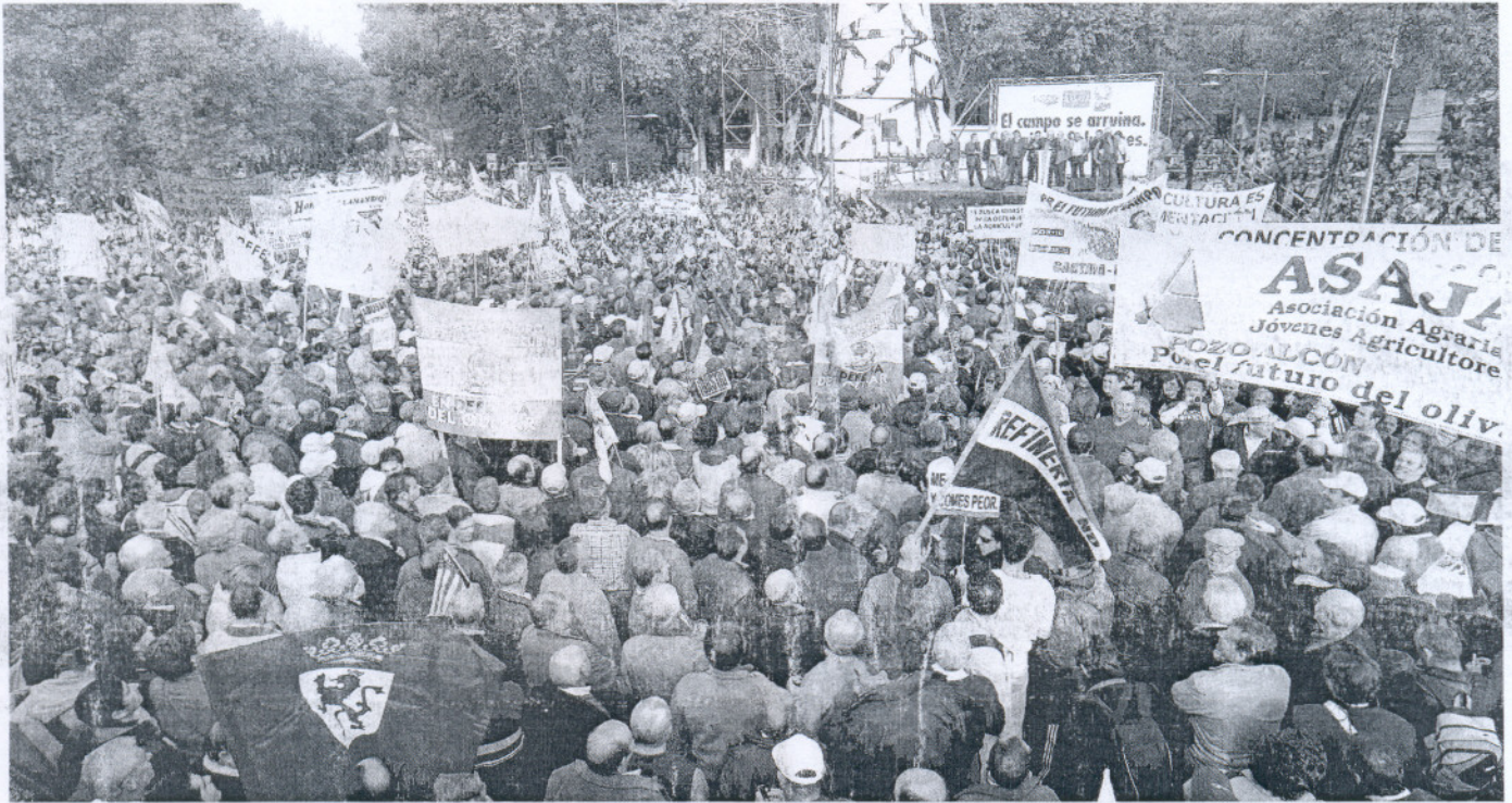
PROTESTA MULTITUDINARIA. Decenas de miles de trabajadores de toda España pidieron soluciones de futuro en la capital española.