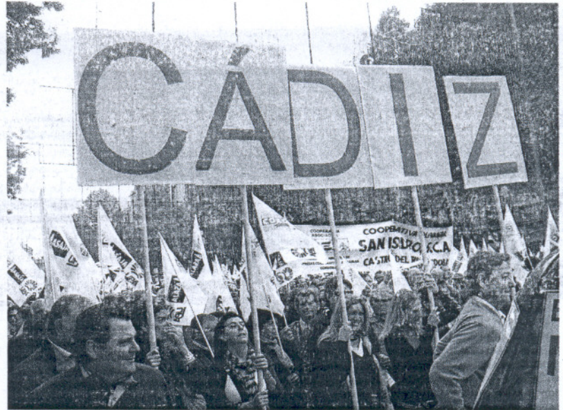
PRESENCIA. Los agricultores de la provincia se hicieron bien visibles en la protesta.

Los camperos de la provincia se dieron cita en la capital tras un viaje de nueve horas en autobús. «Estamos hartos de las montañas de papeles que tenemos que rellenar; de esperar eternas colas en las ventanillas de la administración; hartos de que se dedique más tiempo a los trámites que a trabajar. Por eso, el sector agropecuario ha solicitado que se simplifiquen de forma urgente los trámites y le han pedido al presidente del Gobierno que se ponga a la al-