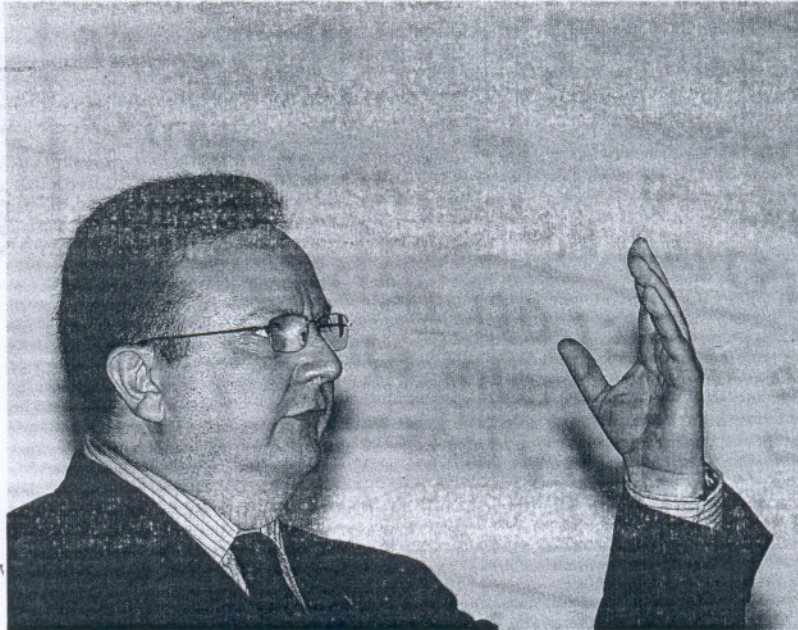
El vicerrector de Investigación, Desarrollo Tecnológico e Innovación, en un momento de su intervención.

De todo se había hablado ya, pero esta es la primera vez que la Universidad gaditana toma partido a favor del proyecto en función del dictamen de un plantel multidisciplinar de expertos en hidrodinámica, en especies y ecología marina, en seguridad marítima, en ordenación del territorio y en meteorología.