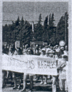
Vecinos durante la protesta.

Más de 200 vecinos protestan contra la regularización de viviendas