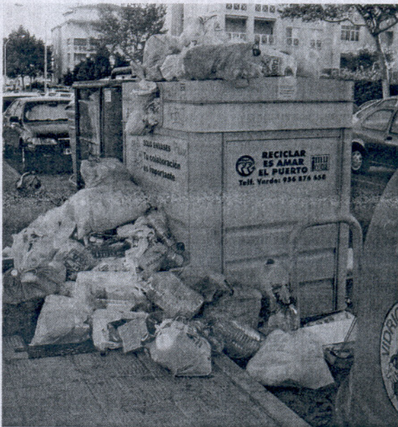
PROTESTA. IU ha denunciado la falta de limpieza. / L. V.

Esta limpieza llevaba siendo reclamada por los residentes de este barrio desde hace bastante tiempo, ya que era frecuente que se acumulara suciedad y matojos en los lindes de la carretera.