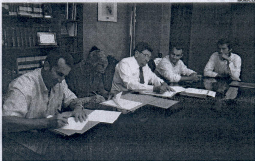
El alcalde de Rota rubricó con el representante de Promociones Castellano para iniciar el nuevo polígono.

Para ello, y según se recoge en el acuerdo, desde el Consistorio se impulsará la urbanización de este sector adelantando parte de la inversión que requieren estos trabajos, entre los que se encuentran desde la creación de via-