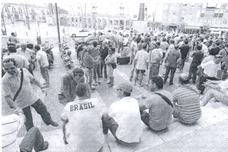
Un nutrido grupo de ex trabajadores se concentró en la mañana de ayer en Jerez.

En este sentido, Tenorio continuó explicando que "ellos hablan de un contrato de calidad y un puesto de trabajo digno, pero los 12.000 euros al año que ofrece Caladeros no es un salario digno: ni para nadie ni para nosotros. Lo único que pedimos es que cumplan el protocolo firmado".