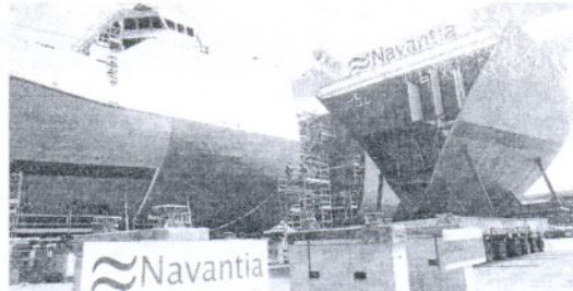
Última puesta de quilla en Puerto Real de un buque para Venezuela.

Ya en la mañana del sábado, ambos navíos dejarán el dique para aguardar en el muelle. Su lugar