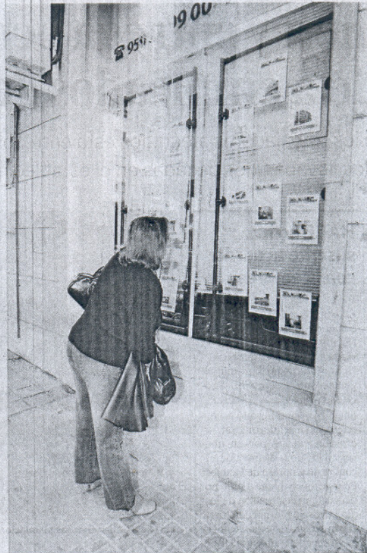
Una mujer observa anuncios de venta de viviendas en una inmobiliaria.