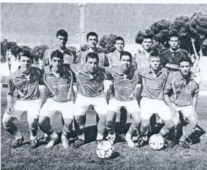
Los juveniles del Rota cayeron con el Domingo Savio en su visita a la capital.