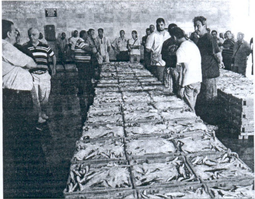
Una de las últimas ventas de boquerón en la lonja de Barbate.

El secretario general de la Federación de Cofradías comentó que los colectivos que aplican estos distintivos de calidad están percibiendo beneficios tangi-