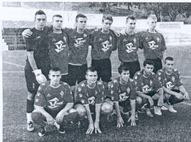
El Chiclana Industrial (Preferente) obtuvo una valiosa victoria en Olvera.