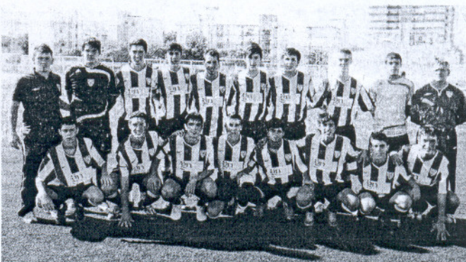
El Deportes Romero juvenil se sitúa líder tras ganar por la mínima al Tiempo Libre.