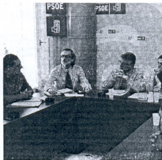
Los representantes socialistas con los miembros del Metal de UGT.

Tras analizar la situación, trabajadores y responsables políticos han acordado mantener reuniones periódicas en una mesa permanente que abordará trimestralmente, "con crisis y sin crisis", el nivel de ocupación de las factorías gaditanas y en concreto, el estado de la industria auxiliar.