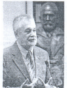
José Antonio Griñán.

Griñán anunciará el jueves cambios en su nuevo Gobierno