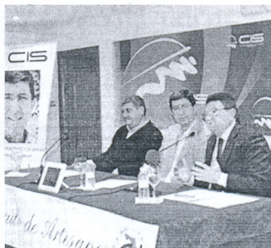
Un instante de la charla del alcalde de Rota organizada por CISanlúcar.

La inclusión del colectivo comarcal, compuesto por los ayuntamientos y entidades agrarias de tales municipios, fue aprobada por la asamblea general de la ARA con la integración de otros tres grupos también reconocidos por la Junta para el nuevo período de ayudas 2009-2015. La asociación