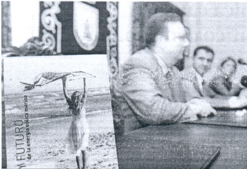
El vicerrector de la UCA, el alcalde chipionero y la responsable de Comunicación de Magtel, en la presentación.