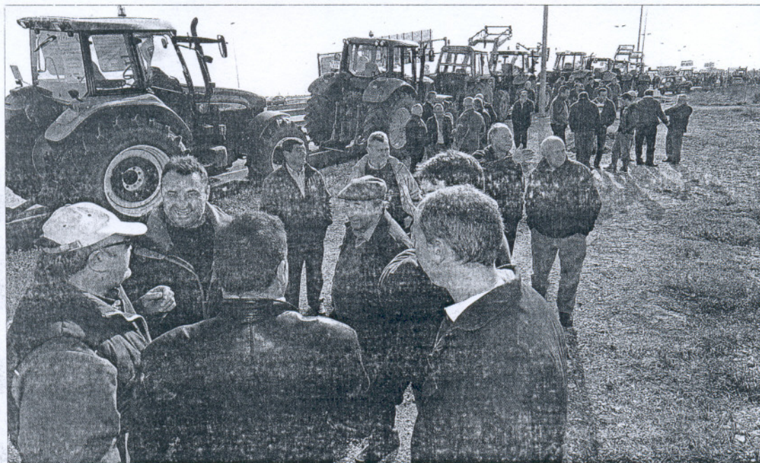
Un grupo de agricultores en la N-1 cerca de Burgos, durante la movilización que el sector llevó a cabo en toda España.