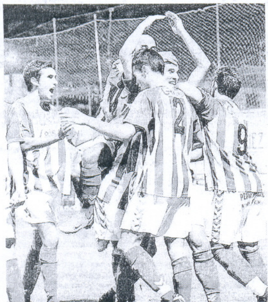
Los jugadores del Sanluqueño quieren repetir hoy esta imagen.

Los verdiblancos piensan redimirse en casa a costa de Los Barrios, que llega tocado