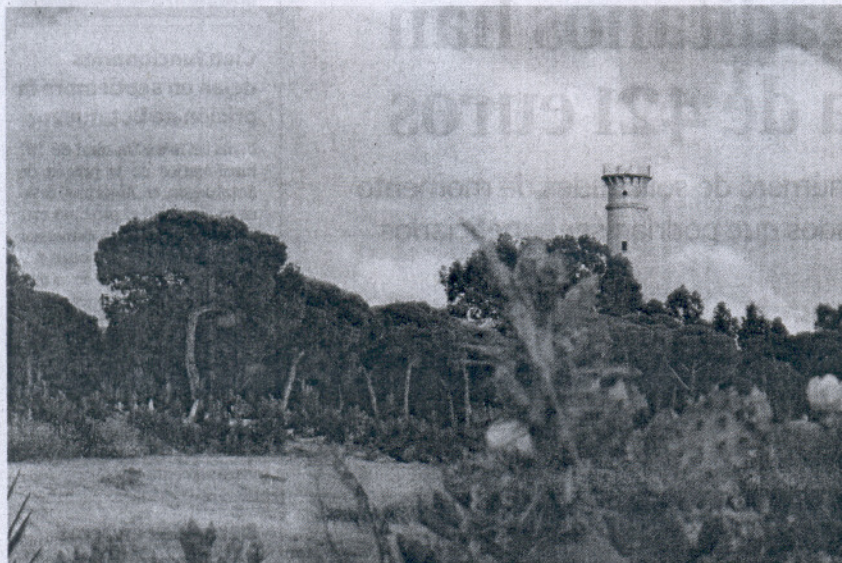
Una vista de los pinares de Bonanza, con el faro de este espacio natural al fondo.