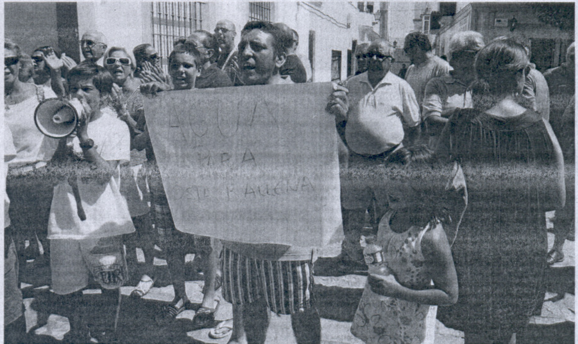
INDIGNACIÓN. Los vecinos de Costa Ballena celebraron numerosas protestas durante el mes de agosto.

La ejecución del Plan General de Obras de la Zona Gáditana fue encomendada por Ley de 31 de diciembre de 1945 a la desaparecida Confederación Hidrográfica del Guadalquivir, sustituida por la Agencia Andaluza del Agua (AAA), dependiente de la Junta de Andalucía. Esta es responsable de la gestión en alta, mientras que cada municipio gestiona en el ámbito de sus competencias el alcantarillado y depuración de vertidos líquidos. Por ello, la Agencia, a través de la Consejería de Medio Ambiente, fue la encargada de poner en marcha unas obras que cerrarían el anillo noroeste, con una tubería que conectaría las infraestructuras de distribución de agua potable de Sanlúcar con el de Costa Ballena y Chipiona. Las obras comenzaron en marzo de 2008 y los problemas económicos de la empresa adjudicataria la paralizaron. La actuación estará lista en octubre.