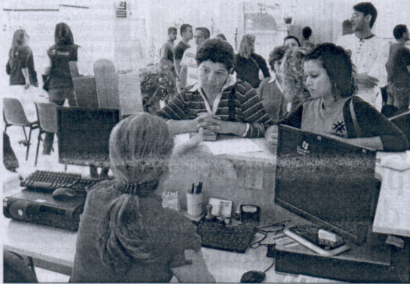
Colas en el mostrador de una oficina de empleo de la localidad de Chiciana en una imagen reciente.

Esta nueva línea de apoyo social alcanzará al 55% o 60% de los desempleados que actualmente carecen de toda protección y además es incompatible con otras rentas públicas. Como pretende la recolocación laboral,