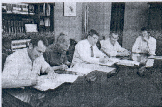
Un momento de la firma del convenio en el Palacio Municipal.

Así, el Ayuntamiento "impulsará la urbanización de este sector adelantando parte de la inversión que requieren estos trabajos, entre los que se encuentran la creación de viarios; la dotación de las canalizaciones de abastecimiento, saneamiento, telecomunicaciones y suministro eléctrico; la