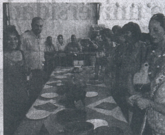
El alcalde y la concejala de Fiestas (a la izquierda) en la degustación gastronómica.

tagonistas, pequeños y mayores disfrutaron de sus fiestas y la caseta de la Asociación de Empresarios y profesionales del campo, Coproem, ganaba el concurso de casetas. Hoy destacan la cabalgata a las siete y el espectáculo de rejoneo.