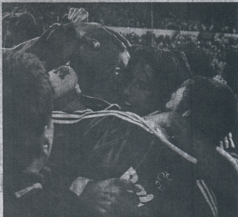
Cannavaro y Robinho se abrazan a Sergio Ramos al final del partido de La Romareda.