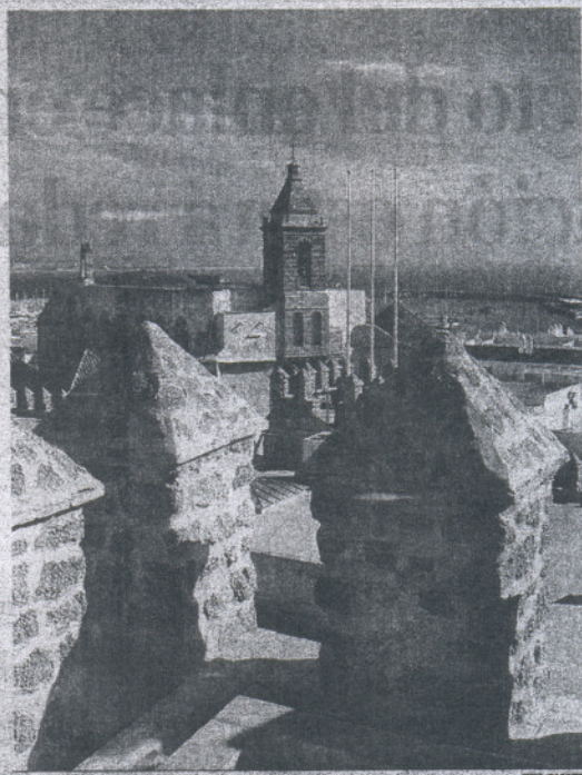
Vista de la localidad de Rota, que permaneció ayer toda la tarde sin agua.

La central de averías de Aquilla y los servicios de emergencia atendieron centenares de llamadas de vecinos advirtiéndoles de los problemas con el agua durante toda la tarde, mientras los técnicos de la Agencia se afanaban en el arreglo del emisario. La reparación finalizó sobre las ocho y la Villa recuperó el suministro entero alrededor de las diez.