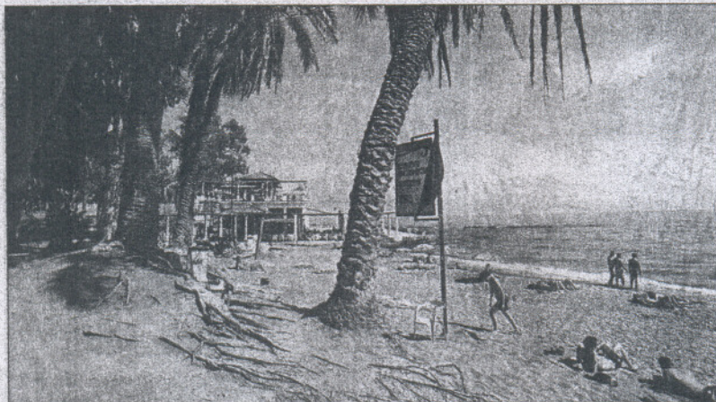
Unos bañistas en la playa del Carmen de Málaga.

El 26,2% de las playas andaluzas ha obtenido este año una bandera azul, repartidas entre 28 municipios, y suman en extensión 103,7 kilómetros de costa. Destaca el caso de Fuengirola, que suma seis distintivos. El número total es muy inferior al conseguido por regiones con menos kilómetros de playa como la Comunidad Valenciana, que suma 95