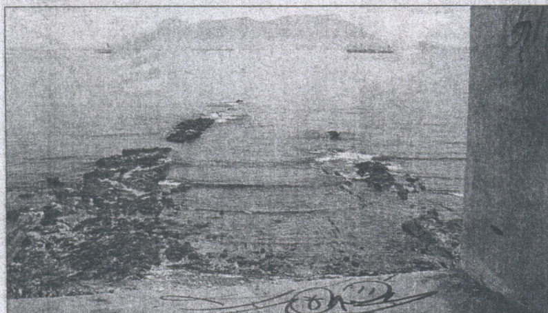
Una imagen de la playa del Chinarral, que sufrió el vertido del Sierra Nava.

Sólo el 26,2% de las playas andaluzas ha obtenido este año una bandera azul