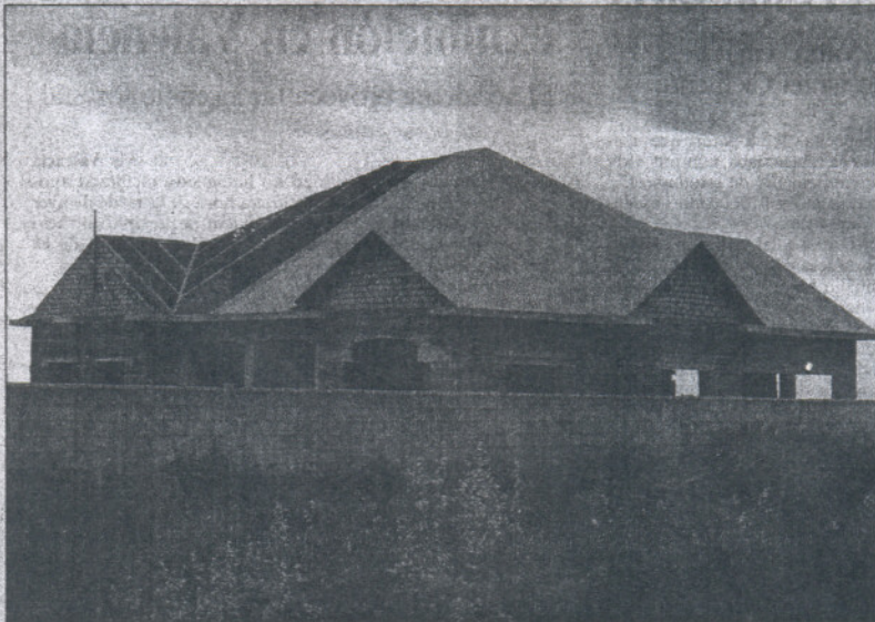
Casa sin terminar en la playa del Puntalejo, en Conil, encargada por el Follarranas.

Para la fiscal antidroga este caso es el mejor ejemplo para explicar el fenómeno detectado el año pasado. Entre los detenidos, había dos contratistas, profesionales de las construcciones, que, según la Guardia Civil, asesoraron a los supuestos narcos en el blanqueo de capitales a través de la construcción de dos casas en Conil, la de 900.000 euros y otra valorada en 350.000 euros, asentadas en terreno no urbanizable. "Estas operaciones sirven para eliminar grandes sumas de dinero negro, tratar de no dejar rastro invirtiendo en casas sin registrar y dificultar así el seguimiento fis-