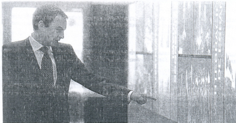
PREVISIÓN. Zapatero ha descartado el día 2 de marzo por temor a la abstención.

El 28 de febrero, jueves, se celebra el Día de Andalucía para conmemorar la celebración en 1980 del referéndum con el que se reivindicó la autonomía andaluza como la de las comunidades históricas. Una jornada festiva que muchos andaluces prolongarán hasta el domingo 2. Ante el éxodo de votantes que puede provocar ese 'puente', el Gobierno se ha decantado por el siguiente fin de semana para organizar las próximas elecciones generales desde la reinstauración de la democracia. Unos comicios que tendrán a los mismos protagonistas que hace cuatro años: José Luis Rodríguez Zapatero y Mariano Rajoy. Entonces, el PSOE logró 164 diputados y el PP, 148.