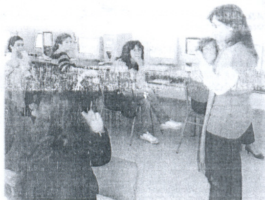
La delegada visitó el nuevo taller destinado a las roteñas.

El curso, que tiene como objetivo ofrecer a las alumnas los conceptos básicos necesarios para que puedan utilizarlo como recurso tanto en el ámbito laboral como personal, consta de seis unidades fundamentales para el conocimiento y el manejo de herramientas ofimáticas, tales como el procesador de texto Word, la hoja de cálculo Excel o el manejo de internet y del correo electrónico. Contempla la iniciación a programas, como almacenar, mover o copiar ficheros, así como aspectos relacionados con el teletrabajo o la teleformación.