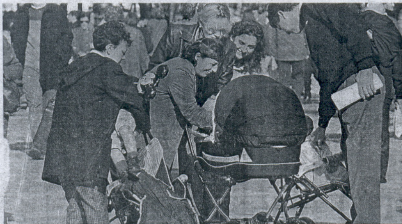
El aumento de la natalidad y la llegada de inmigrantes han posibilitado el incremento generalizado del padrón.