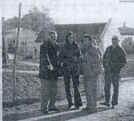
Ecologistas fueron acompañados por miembros del equipo de Gobierno.

Además, también visitaron junto con personal técnico del Centro de la Mayetería la granja en la que se cuenta con vacas, gallinas, etc; el huerto escolar que sirve para acercar a los más pequeños todo tipo de cultivos que plantaban los antiguos mayetos, así como la forma en la que se cultiva cada planta, o como se deben orientar; los huertos que actualmente cultivan antiguos mayetos y hombres del campo; así como las distintas instalaciones de este centro.