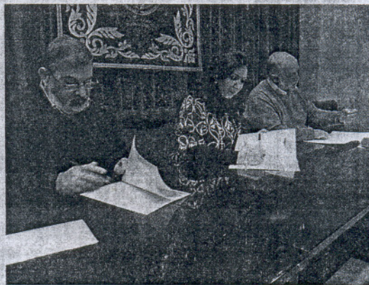
El Consistorio firmó un acuerdo con los comerciantes locales.

Para aprovecharse de la gratuidad de la primera media hora, los ciudadanos no tendrán que