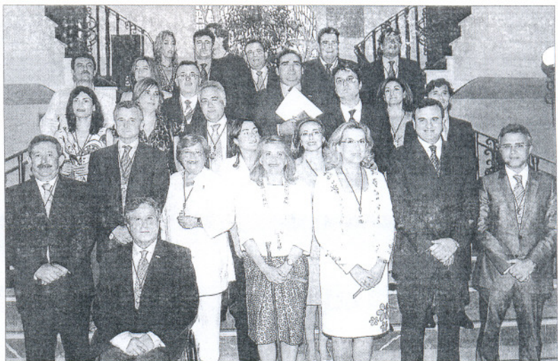
La corporación al completo de Marbella, tras tomar posesión el pasado 16 de junio.