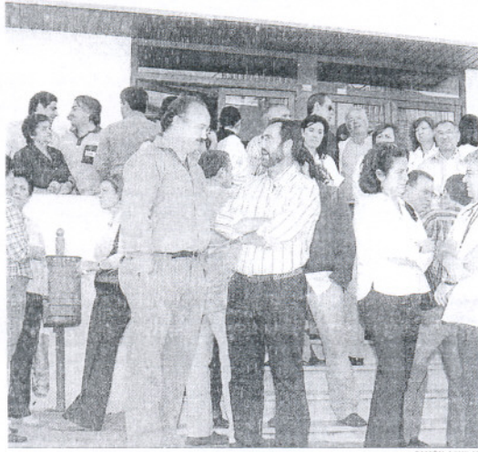
Casi medio centenar de personas participaron en la protesta en Arcos.

Cabe recordar que el sanitario agredido en Jédula recibió golpes y patadas por parte de un vecino cuando lo auxiliaba en un bar de la pedanía. Ésta no es la primera agresión que sufre un enfermero adscrito al centro de Jédula. Hubo otro caso a principios del mes de mayo de este año, que fue rechazado del mismo modo por el