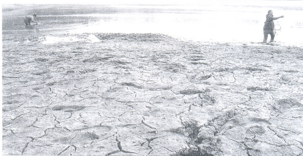
Efectos del calentamiento global en un estanque en la provincia china de Jiangxi.

ENCUESTA DE LA BBC SOBRE EL CAMBIO CLIMÁTICO