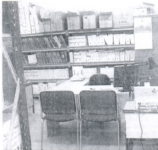
Una de las fotos enviadas por el sindicato SPJ a la Junta.