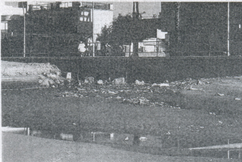
Los concejales del equipo de Gobierno en funciones no han preparado el litoral para el verano