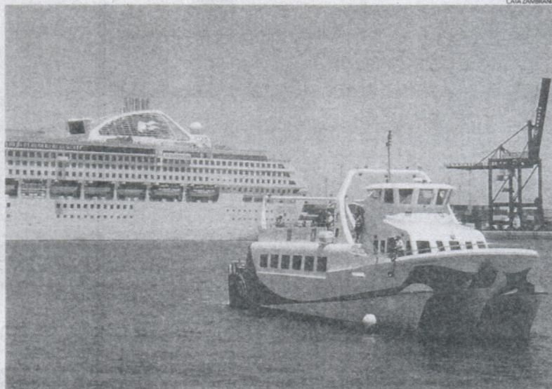
De momento, el servicio del catamarán que une Cádiz con Rota y El Puerto no se verá afectado este mes.

De hecho, TCM-UGT y Trapsa comenzarán a negociar un acuerdo que regule la situación laboral de los trabajadores de este servi-