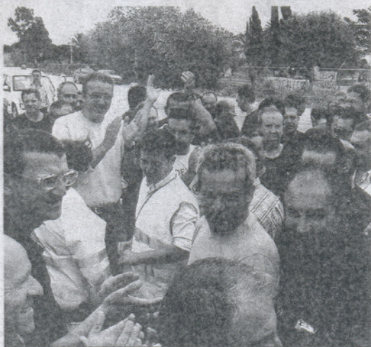
Trabajadores de Delphi, en una de las protestas en la factoría.