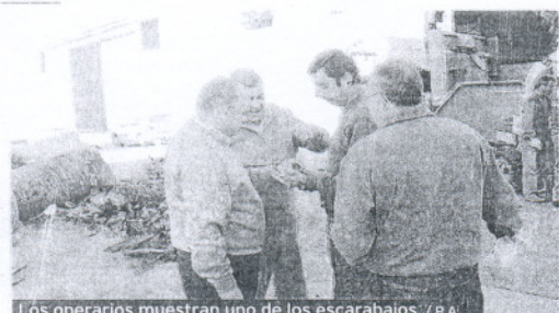
Los operarios muestran uno de los escarabajos.