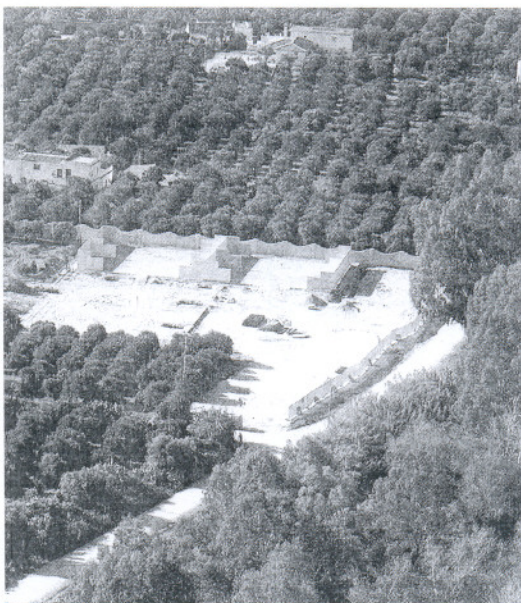
Vista de la parcela del ex edil popular.

ahora al equipo de gobierno del Partido Socialista que el terreno vuelva a su situación inicial y se repare todo el daño causado. "El impacto visual y los perjuicios ambientales que podría sufrir la zona no debe ser consentido por nuestras autoridades", prosigue.