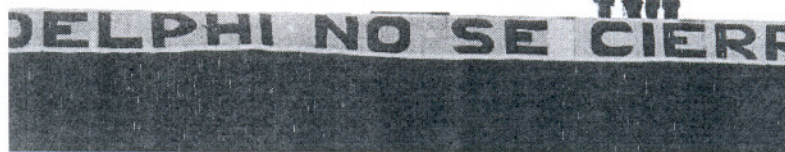
IU crítica que el plan no contemple medidas concretas para paliar la crisis de Delphi.

Por otra parte, el parlamentario crítico que el plan "no contenga medidas concretas para solucionar, por ejemplo, el problema de Delphi" y apostilló que "pa-