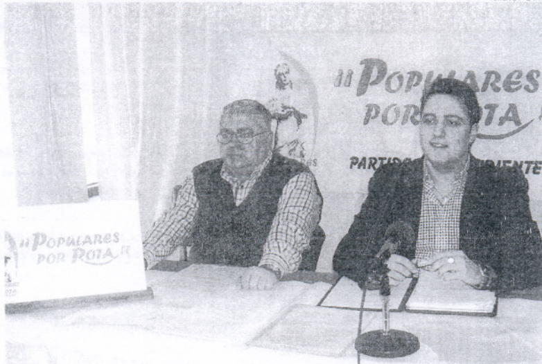
El portavoz de populares por Rota daba a conocer esta denuncia en una rueda de prensa.

Los hechos se remontan al 22 de octubre, cuando la portavoz del PP atendía a los medios de comunicación locales y nacionales