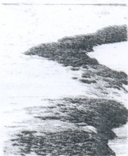
Los corrales, un peligro.

Unas colisiones que, hasta la fecha, no han provocado desgracias personales y sólo han derivado en rotura de cascos, motores, hélices y en el caso concreto de los Corrales de pesca, algunas embarcaciones se han quedado atrapadas dentro del seno de los mismos.