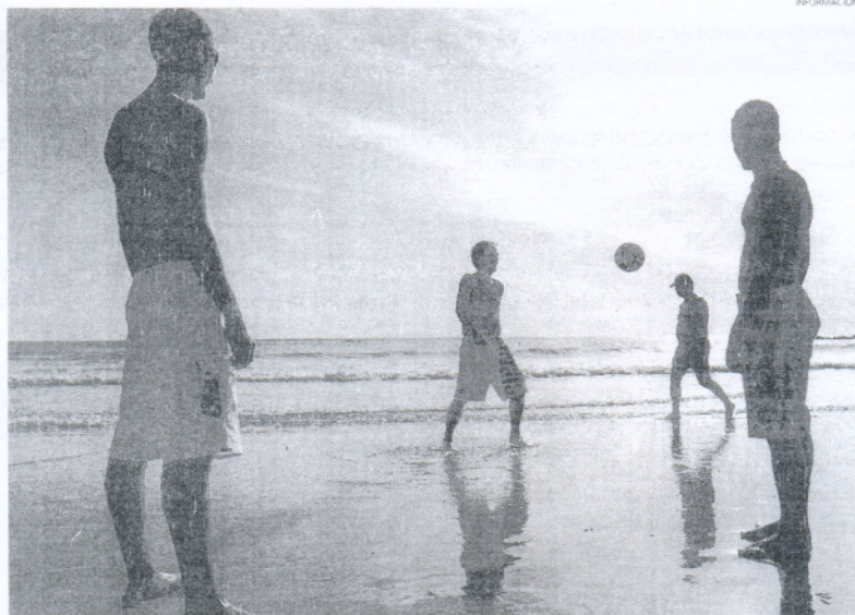
Casi 2400.000 turistas han pasado por los establecimientos hoteleros de la provincia desde enero a octubre.

Así, por ejemplo, en cuanto a las pernотaciones, estas ascendieron a 610.310, lo que supone un 5,29 por ciento más que en 2006, según informó ayer en un comunicado el Patronato de Turismo a partir del análisis del Observatorio Turístico de la Provincia, que también recoge que la ocupación media se situó en 44,93 por ciento de las plazas ofertadas