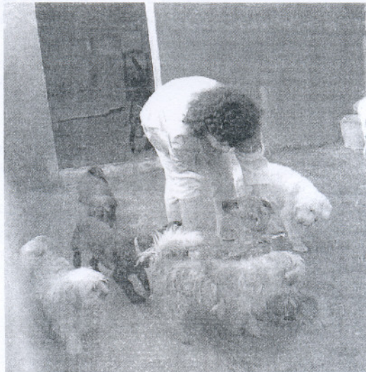
Los operarios trasladan a los animales a las nuevas instalaciones.

El presidente de la Mancomunidad no ha entrado a valorar la decisión judicial, pero ha iniciado la redacción de una carta a la jueza, que ha decretado el cierre cautelar de la perrera por existir indicios de maltrato animal, para mostrarle la inseguridad e intranquilidad que ha causado a los municipios con la suspensión del servicio público.