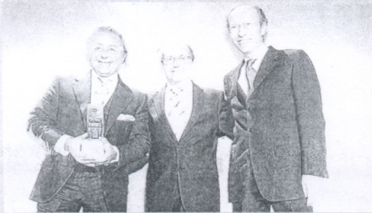
EMBAJADORES. Victorio &amp; Lucchino en la ceremonia.