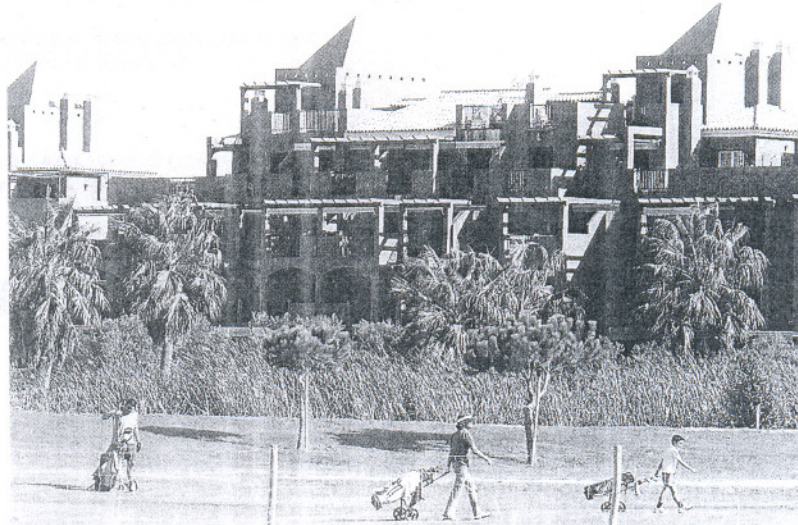
Los terrenos demandados por Chipiona fueron desarrollados urbanísticamente por Rota