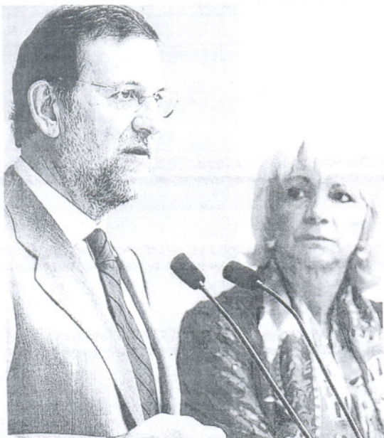
Rajoy, ayer, con la alcaldesa de Cádiz, Teófila Martínez