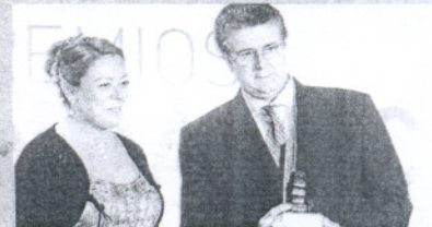
COMUNICACIÓN. Julián Martínez de El País.