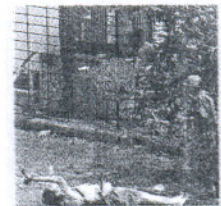
El fotógrafo, agonizante.

El ejército birmano mata a diez personas, entre ellas un fotógrafo