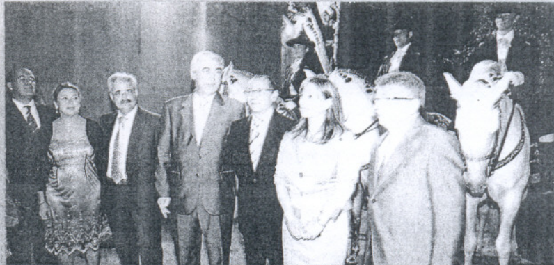
FIESTA. Los caballos de la Real Escuela tomaron protagonismo.

Los premios Andalucía del Turismo 2007 encontraron en la Real Escuela de Arte Ecuestre el decorado perfecto para un homenaje ameno a figuras representativas del sector