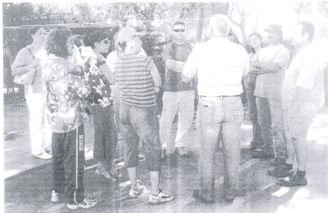
Los trabajadores del camping municipal se reunieron con el sindicato UGT en las instalaciones del mismo para ofrecer unas manifestaciones públicas.

El sindicato pide al Ayuntamiento que rescate el servicio de la empresa privada