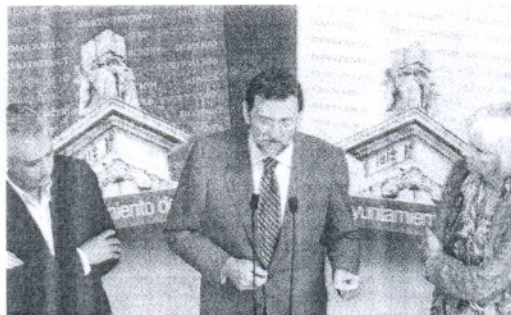
Javier Arenas y Teófila Martínez, ayer, junto a Mariano Rajoy.

este sentido, mostró su total apoyo a los proyectos municipales previstos para el Casulló de San Sebastián y Tabacalera. El líder del PP quiso reafirmar en Cádiz el compromiso de su partido con la Monarquía y con la bandera de España ante la polémica de las últimas semanas. —PÁGINA 7—