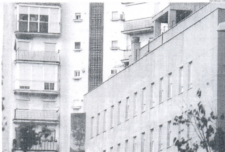
Jerez y Rota experimentaron los mayores descensos del precio de la vivienda de segunda mano en el verano.

Además, el precio medio de la vivienda de segunda mano en las localidades de Jerez de la Fronte-