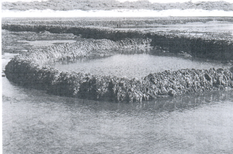
El jefe de la Demarcación recibe a representantes de Unimar y Acor en una reunión en Cádiz.

"Ahora es un buen momento para que los mariscadores conozcan el proyecto que ya está en el Ayuntamiento de Rota con idea