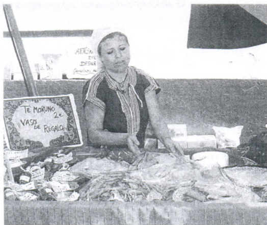
El mercado incluye un programa de actividades complementarias.