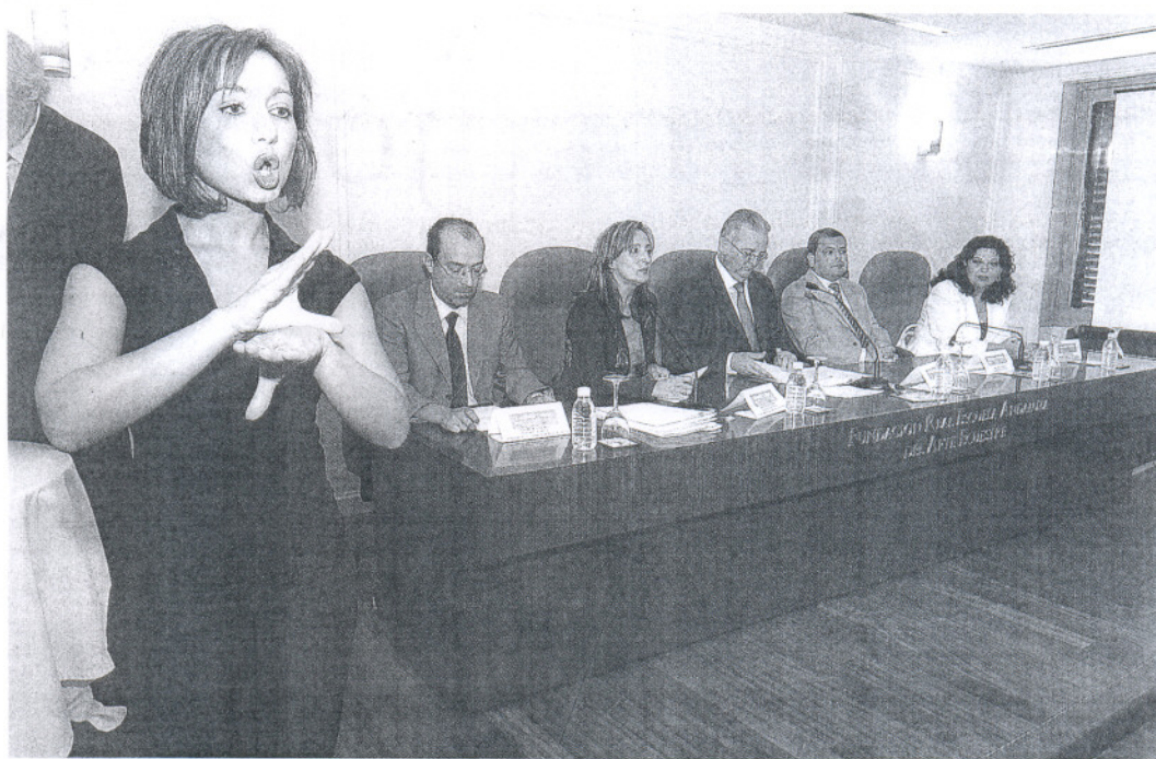
Un momento del acto de presentación, en Jerez, del plan que busca fomentar el empleo en territorios desfavorecidos.

Estas zonas, integradas por 107 municipios y una población de 1,6 millones de habitantes, suman un volumen de paro registrado de 177.500 personas, lo que supone