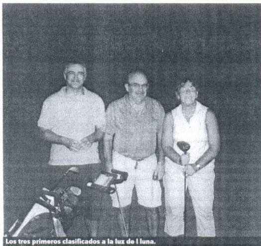
Los tres primeros clasificados a la luz de la luna.

El original evento fue seguido de una estupenda barbacoa en la terraza del Restaurante Al Mar del Club de Golf, durante la cual, se compartieron todos los entusiasmos comentarios inspirados por esta original y emocionante experiencia. Se iluminaron las ban-