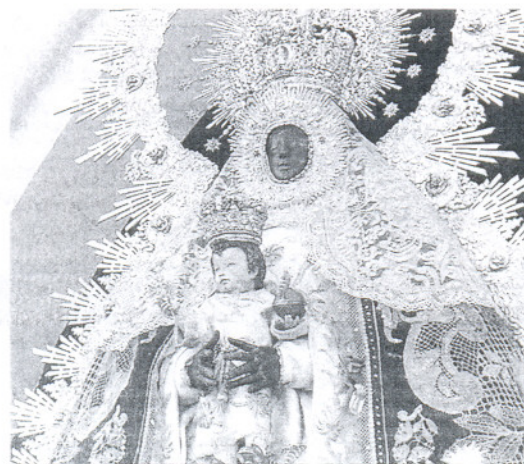
Imagen de la Virgen de Regla.